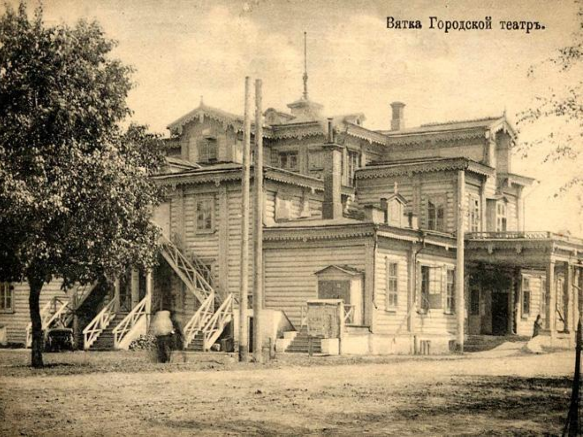
Вятка Городской театр.