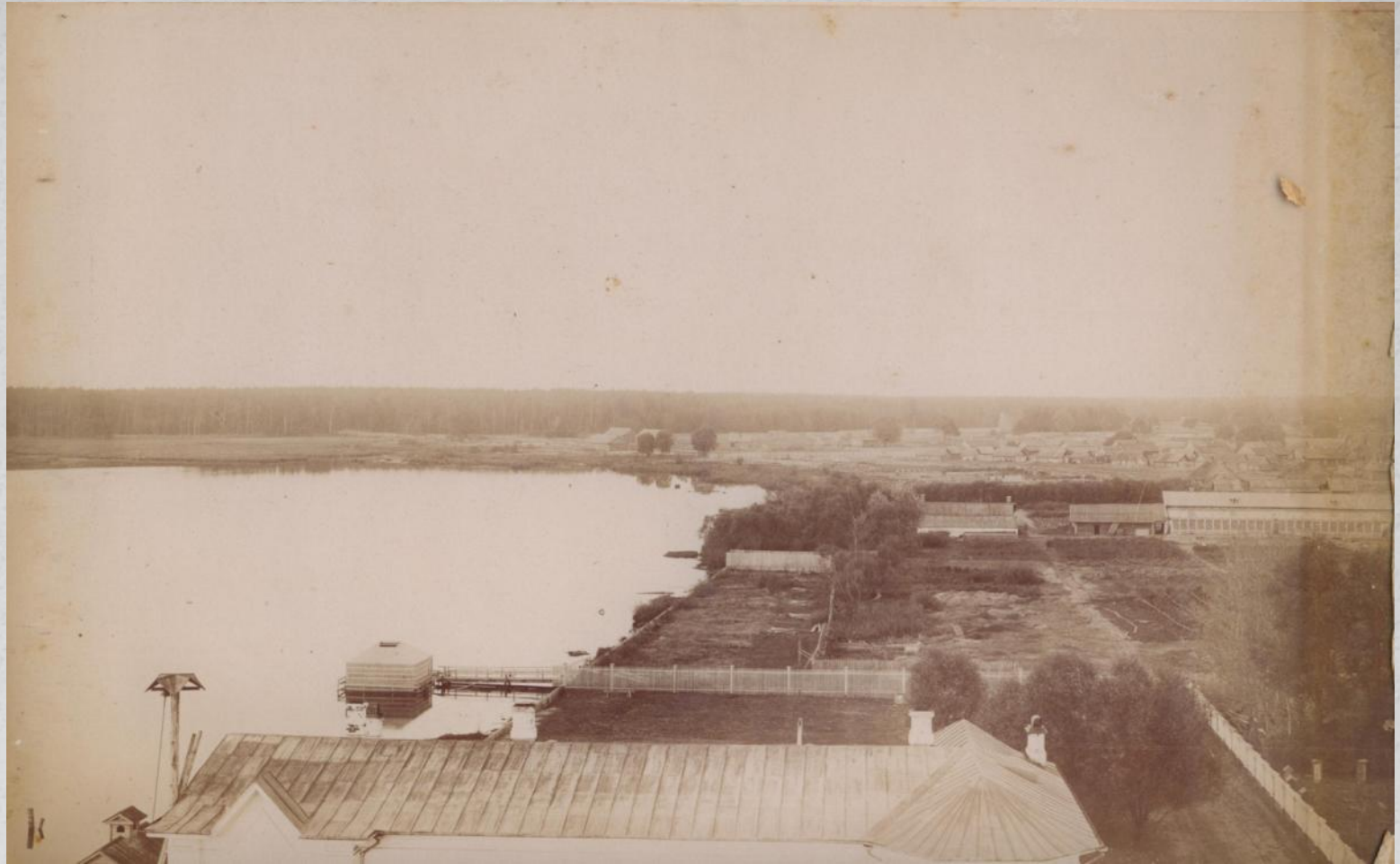
Плотина, устроенная на речке Гусь в 1851 году, разделила усадьбу на левобережную и правобережную части.