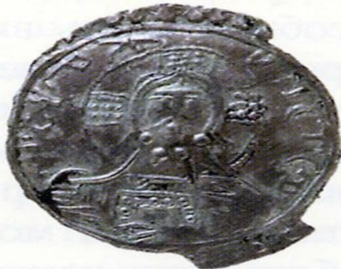
Златник и сребреник Владимира Святославича. Государственный Эрмитаж, Санкт-Петербург.