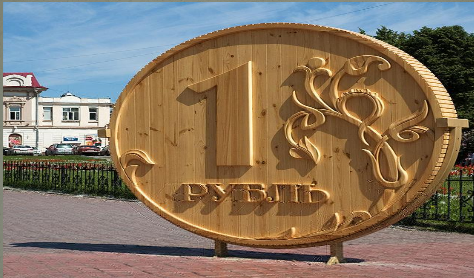
Памятник Рублю в Томске