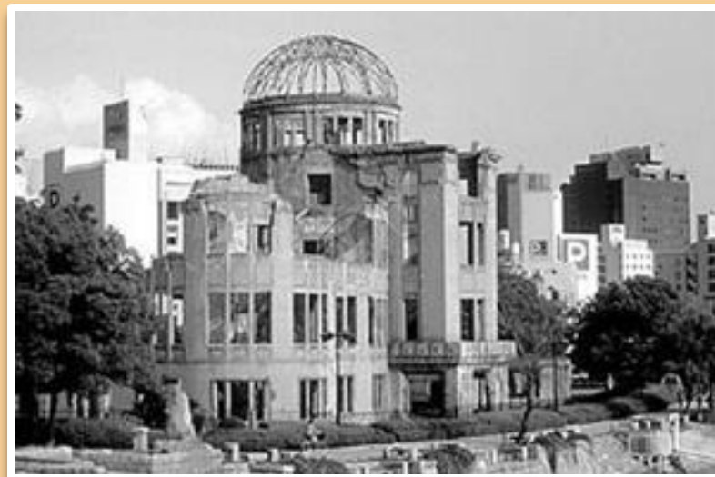
Хиросима. 2005 г.

Огромный огненный, похожий на большую поганку, ядерный взрыв накрыл города. Рушились дома, чернели деревья, замертво падали люди. Города превратились в выжженную пустыню и вымерли. Жертвами бомбардировки в Хиросиме были 140 тысяч человек, в Нагасаки – 75 тысяч.