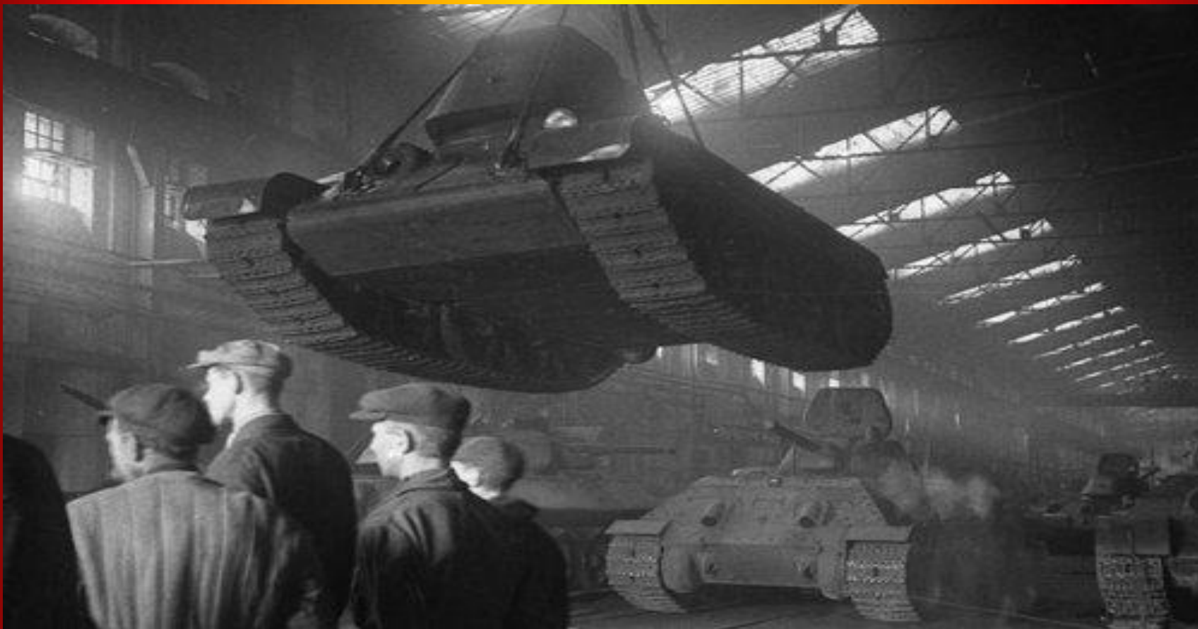
Тракторный завод, выпускавший танки и моторы.