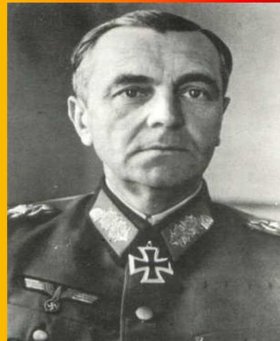
Фридрих Вильгельм фон Паулюс С 30 декабря 1941 по 1 февраля 1943 г. командовал 6 армией, наступавшей на Сталинград

Во главе римского войска стоял консул Паулюс.