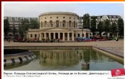
Париж. Площадь Сталинградской битвы, Ротонда де ла Виктория, Девятнадцатый

В Париже с 1946 г. имя «Сталинград» носят площадь, бульвар и станция метро.