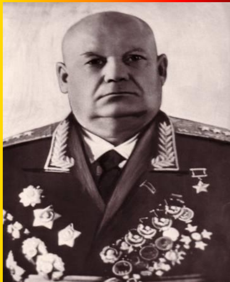
М.С. Шумилов генерал-лейтенант (с 31.12.1942г.)