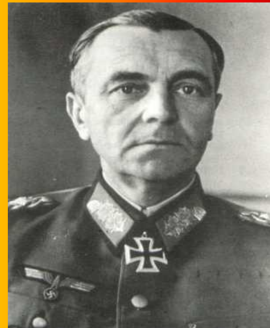
Фридрих Вильгельм фон Паулюс С 30 декабря 1941 по 1 февраля 1943 г. командовал 6 армией, наступавшей на Сталинград