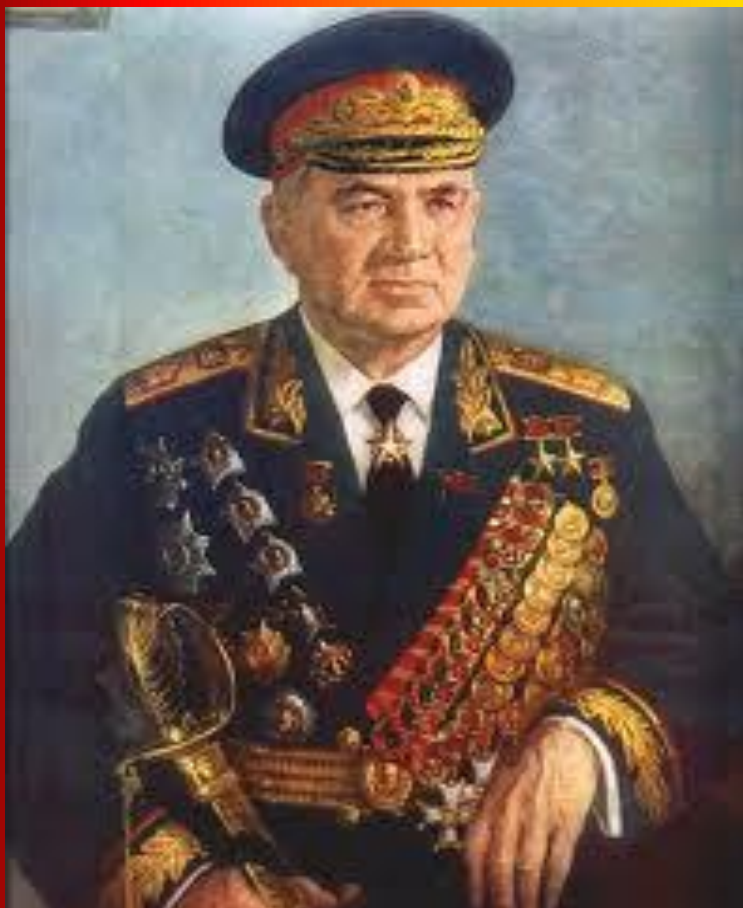
В.И. Чуйков генерал-лейтенант (с 28.07. 1942г.)