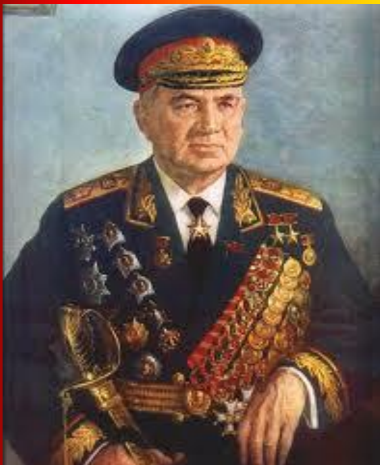
В.И. Чуйков генерал-лейтенант (с 28.07. 1942г.)