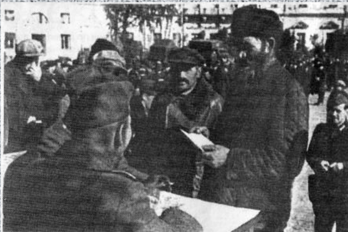
Слуцк (Павловск). Регистрация мужского населения на площади перед дворцом. 1941 год, сентябрь