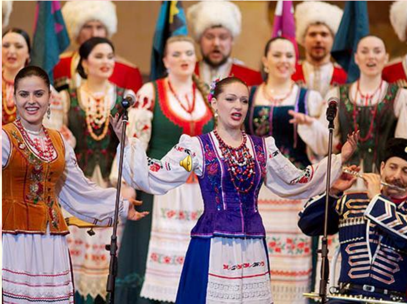
«Полюбила Петруся» Народная песня