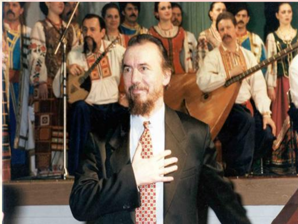
Кубанский казачий хор Руководитель Виктор Гаврилович Захарченко