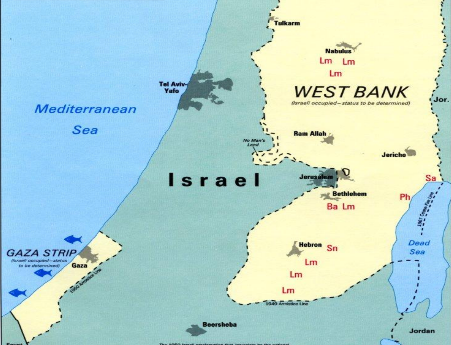
The 1950 Israeli proclamation that Jerusalem be the national