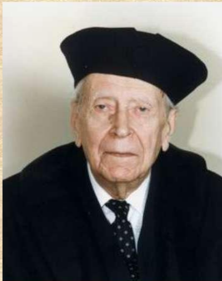
Д.С. Лихачев в мантии Почетного доктора СПбГУП.