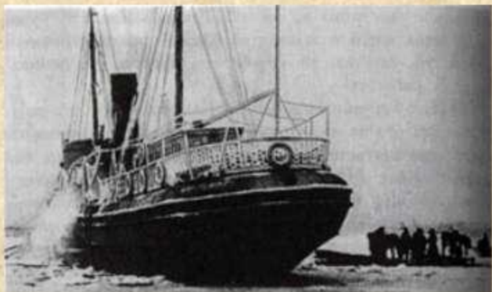
Знаменитый пароход "Глеб Бокий", в трюме которого перевозили заключенных