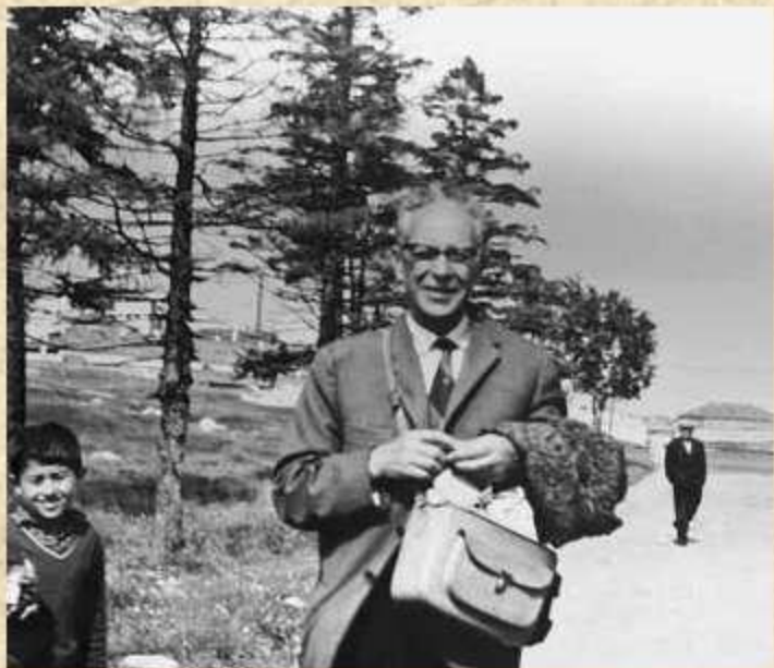
Д. С. Лихачев на Соловках. 1966.