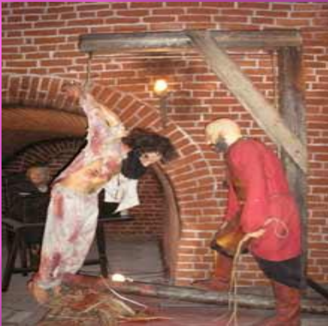
Фрагмент экспозиции "История телесных наказаний на Руси", расположенной в Пыточной башне