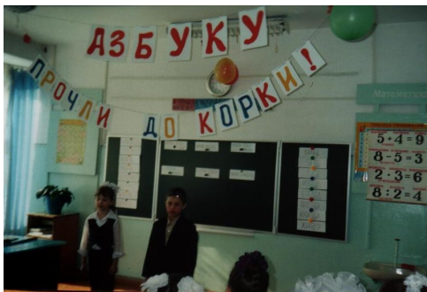
Прощание с Азбукой