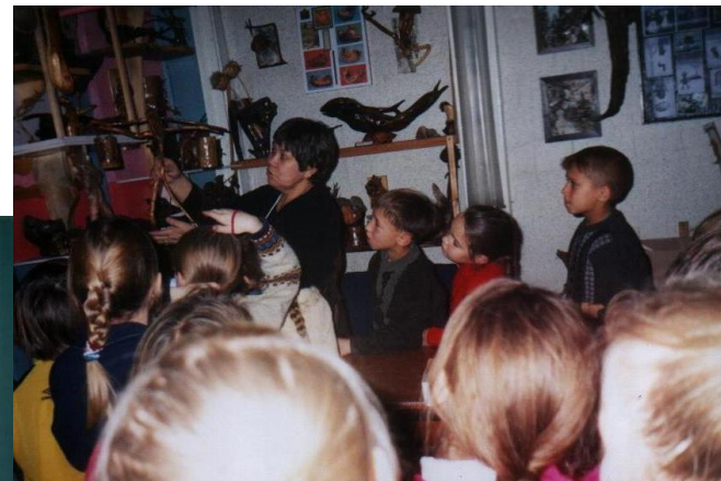
В школе народных ремесел