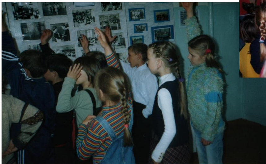
В школьном музее «Память»