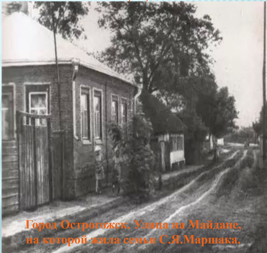
Город Острогожск. Улица на Майдане, на которой жила семья С.Я.Маршака.