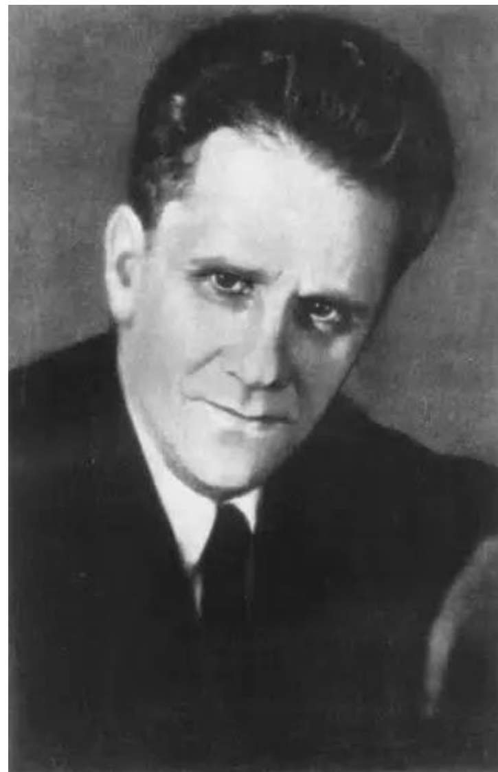
Илья Яковлевич Маршак (М. Ильин) младший брат С.Я. Маршака