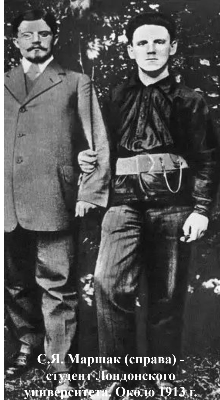
С.Я. Маршак (справа) - студент Лондонского университета. Около 1913 г.