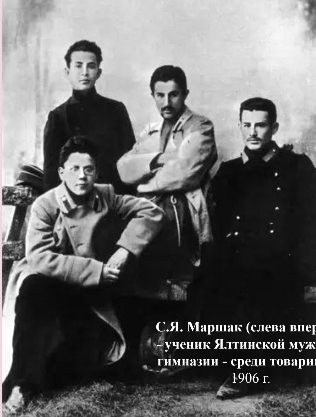
С.Я. Маршак (слева впер- - ученик Ялтинской мужской гимназии - среди товарищей 1906 г.