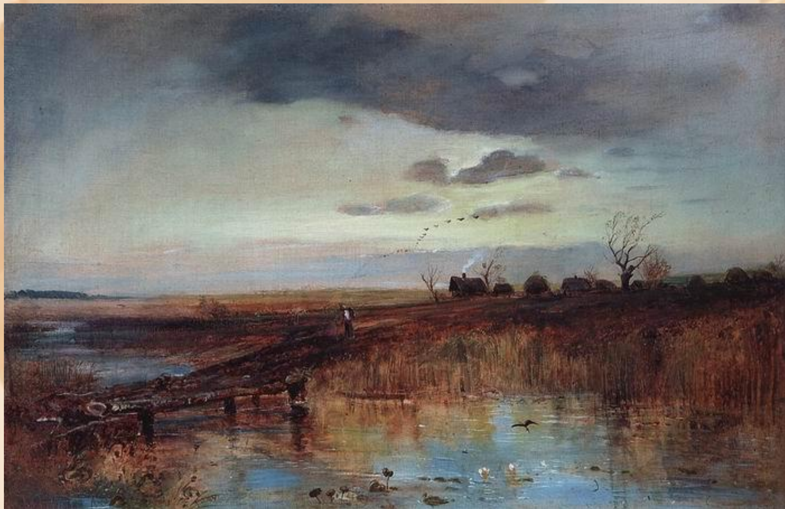
Алексей Саврасов «Осень».