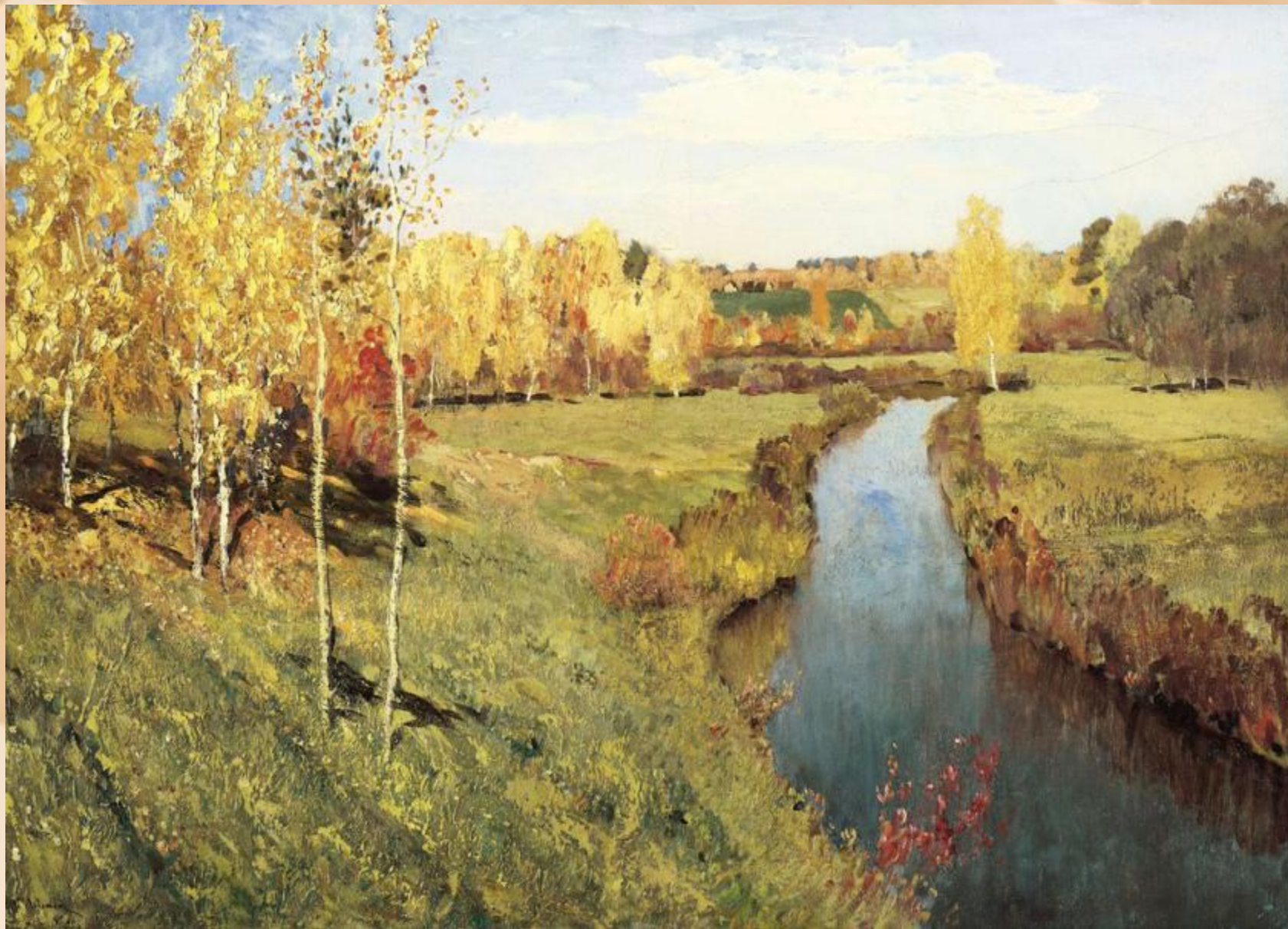
Золотая осень. И. И. Левитан