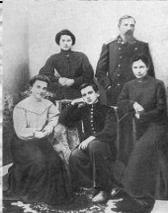
Семья Маяковских, Кутаиси, 1905 год