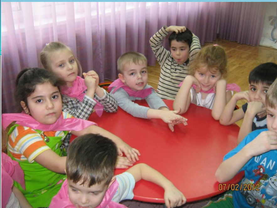
● Команда "Лучики"