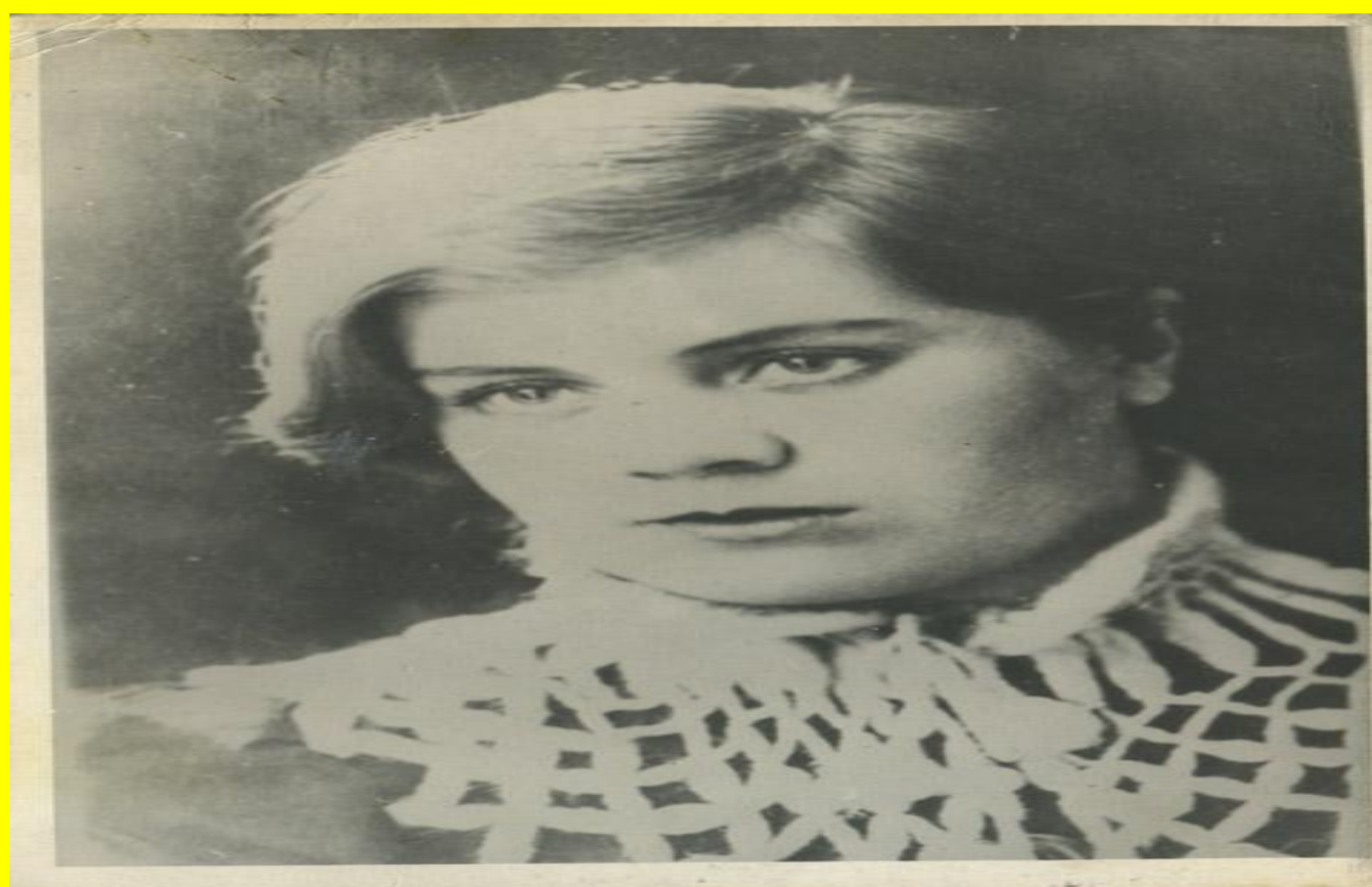
ФОТО 1941 ГОДА