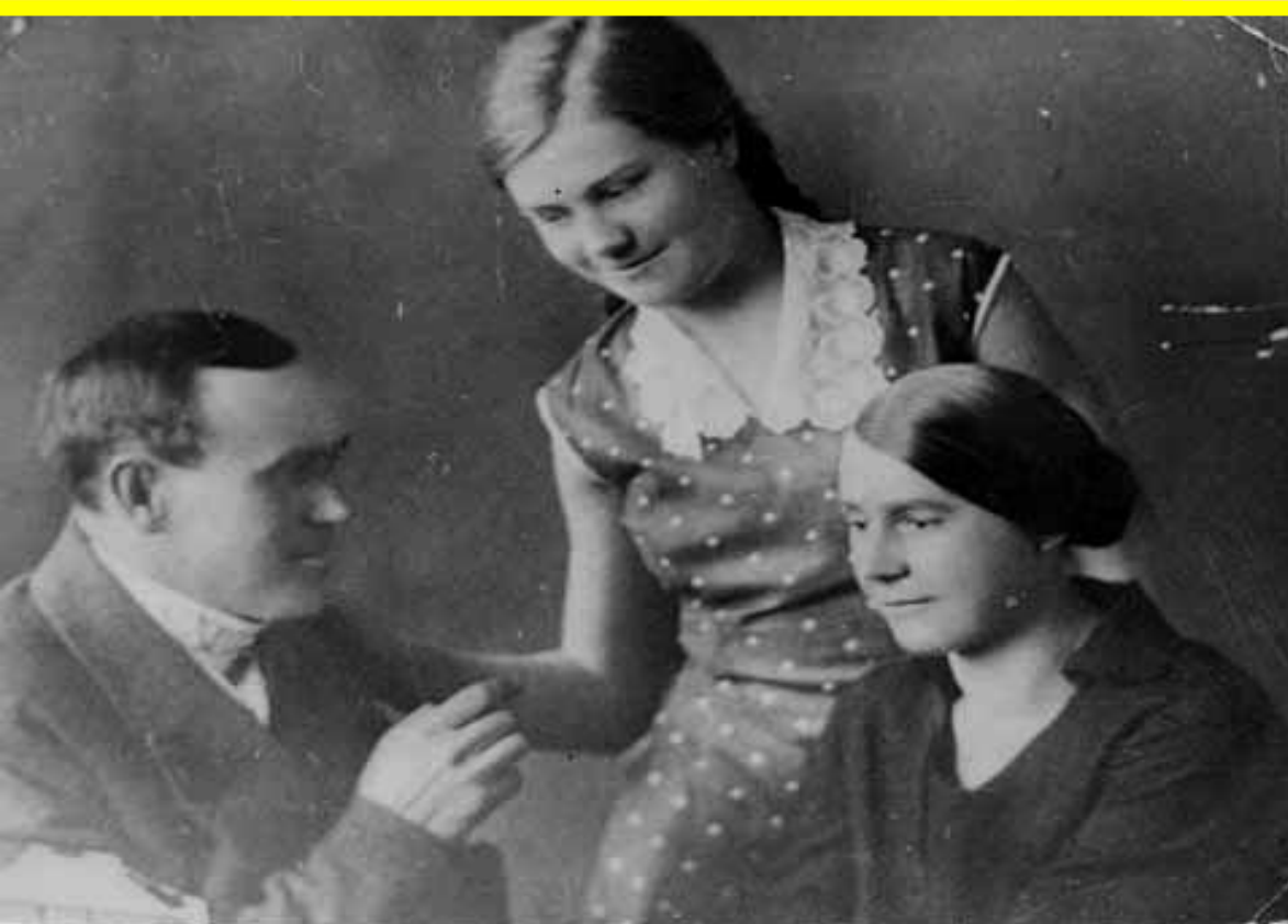
ФОТО ВЕРЫ С РОДИТЕЛЯМИ