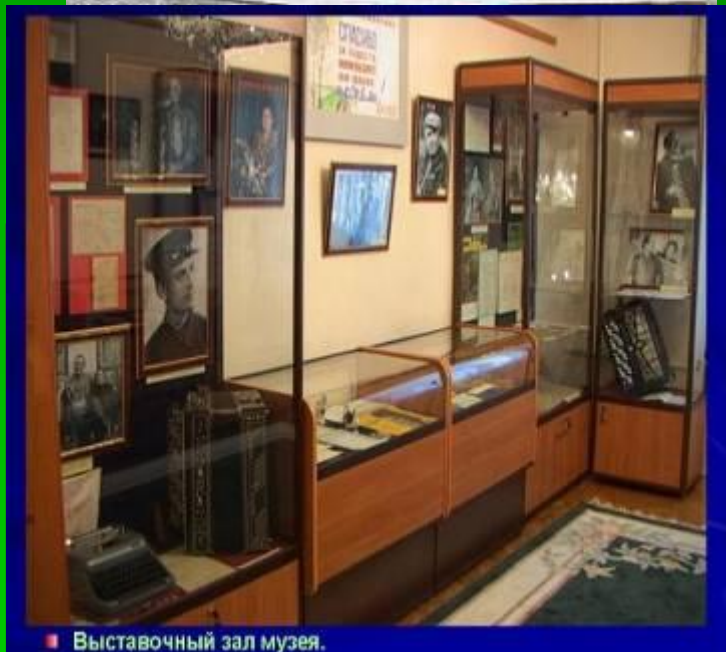
■ Выставочный зал музея.