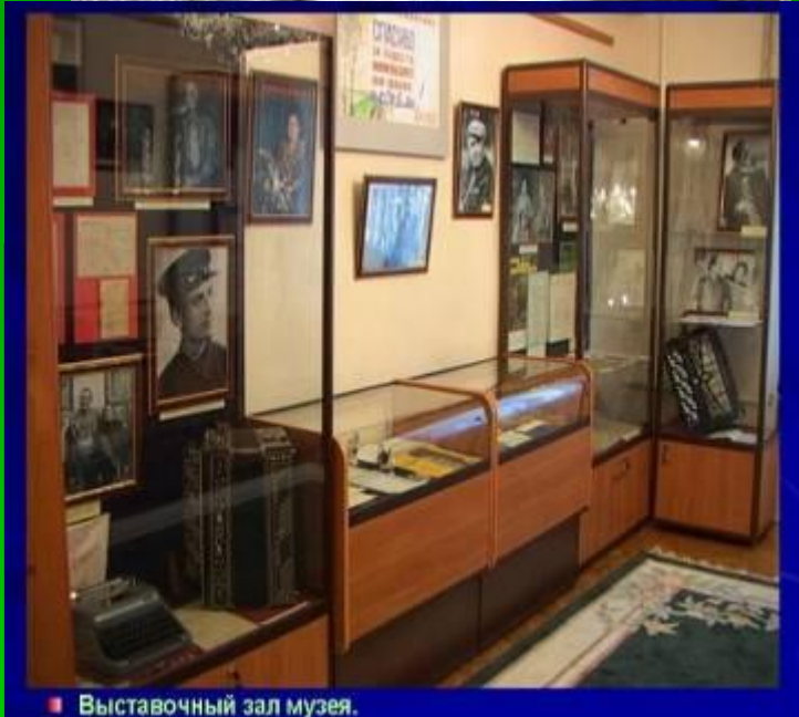
■ Выставочный зал музея.