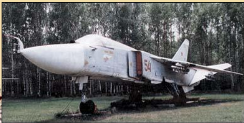
Фронтальной бомбардировщик Су-24