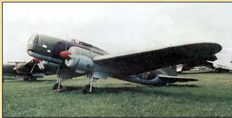
Транспортно-пассажирский самолет Ли-2