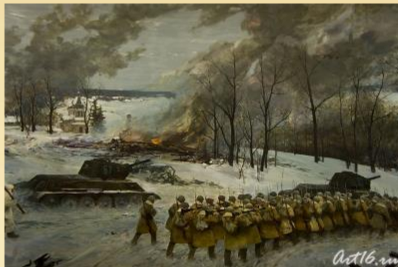
Диорама "Контрнаступление советских войск под Москвой" (фрагмент)