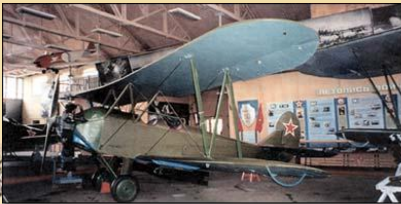
Многоцелевой самолет У-2 (По-2)