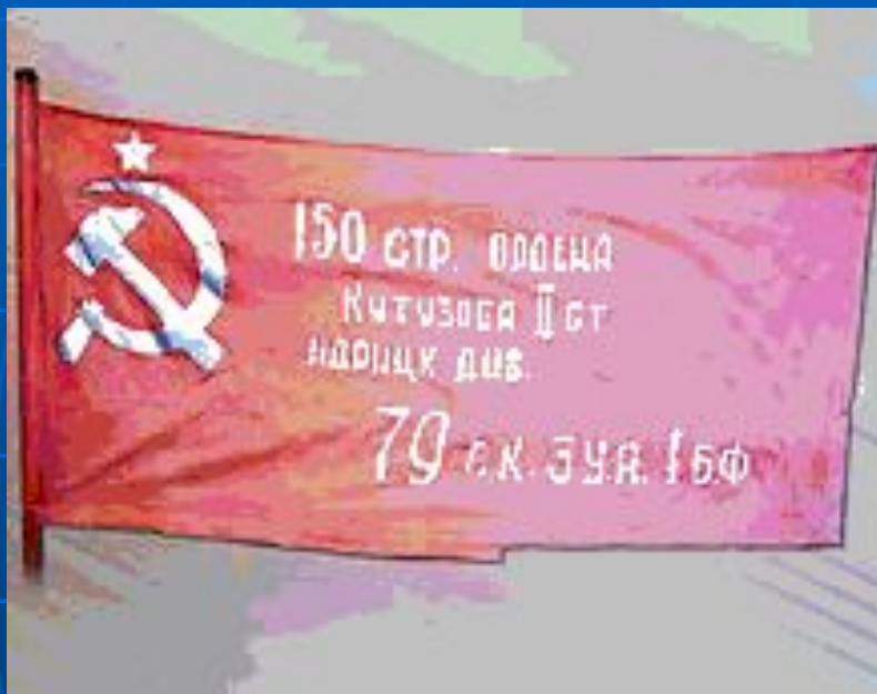
Знамя Победы, водружённное над рейхстагом в ночь на 1 мая 1945 года М.А. Егоровым и М.В.Кантария.