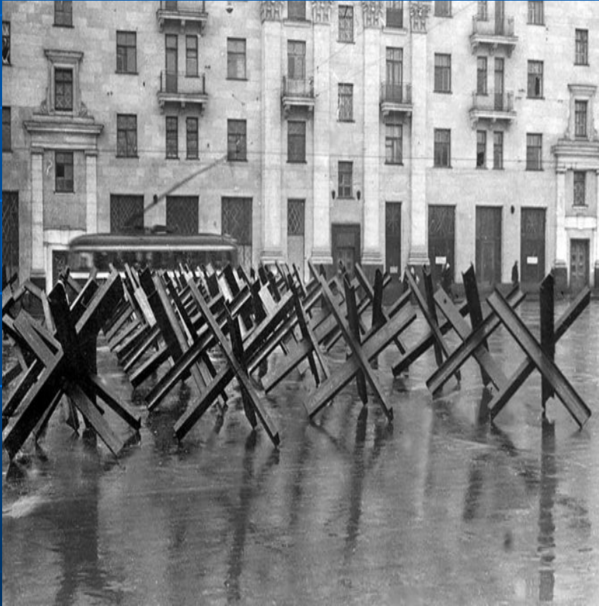
Противотанковые ежи на улицах Москвы