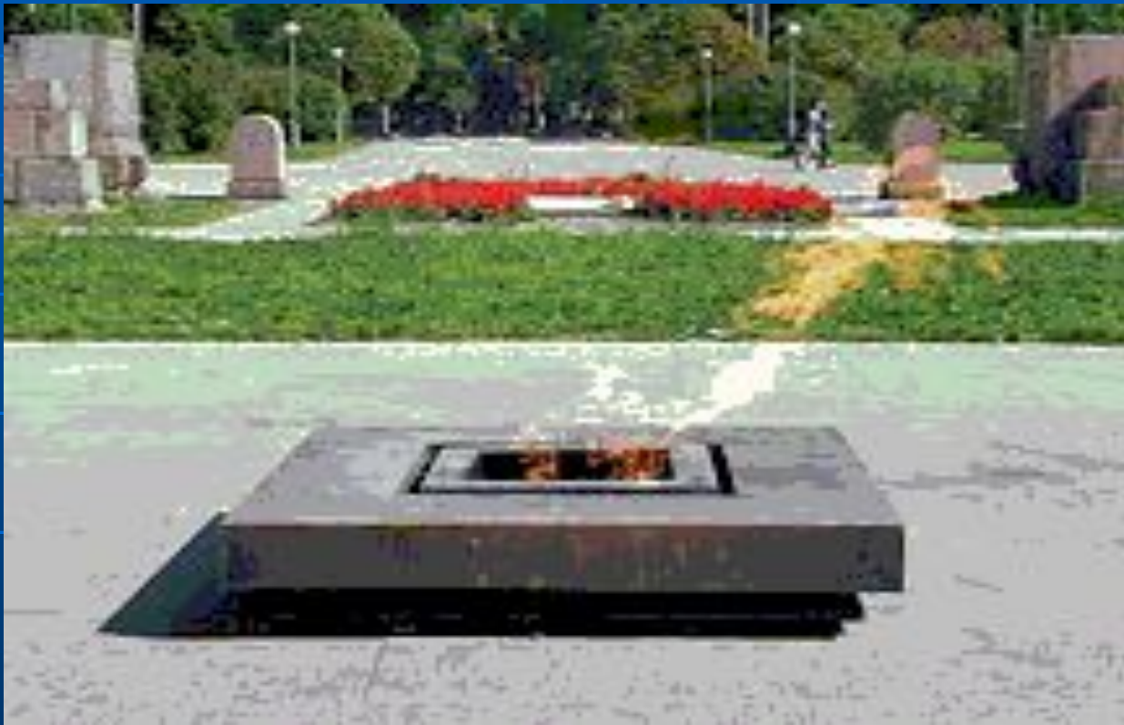
Вечный огонь на Марсовом поле. Санкт – Петербург.