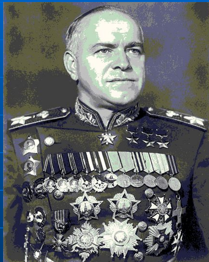
Трижды герой Советского Союза Георгий Константинович Жуков.