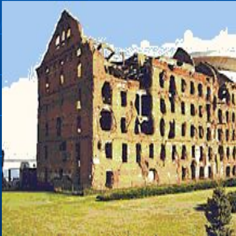
Волгоград. Дом Павлова.