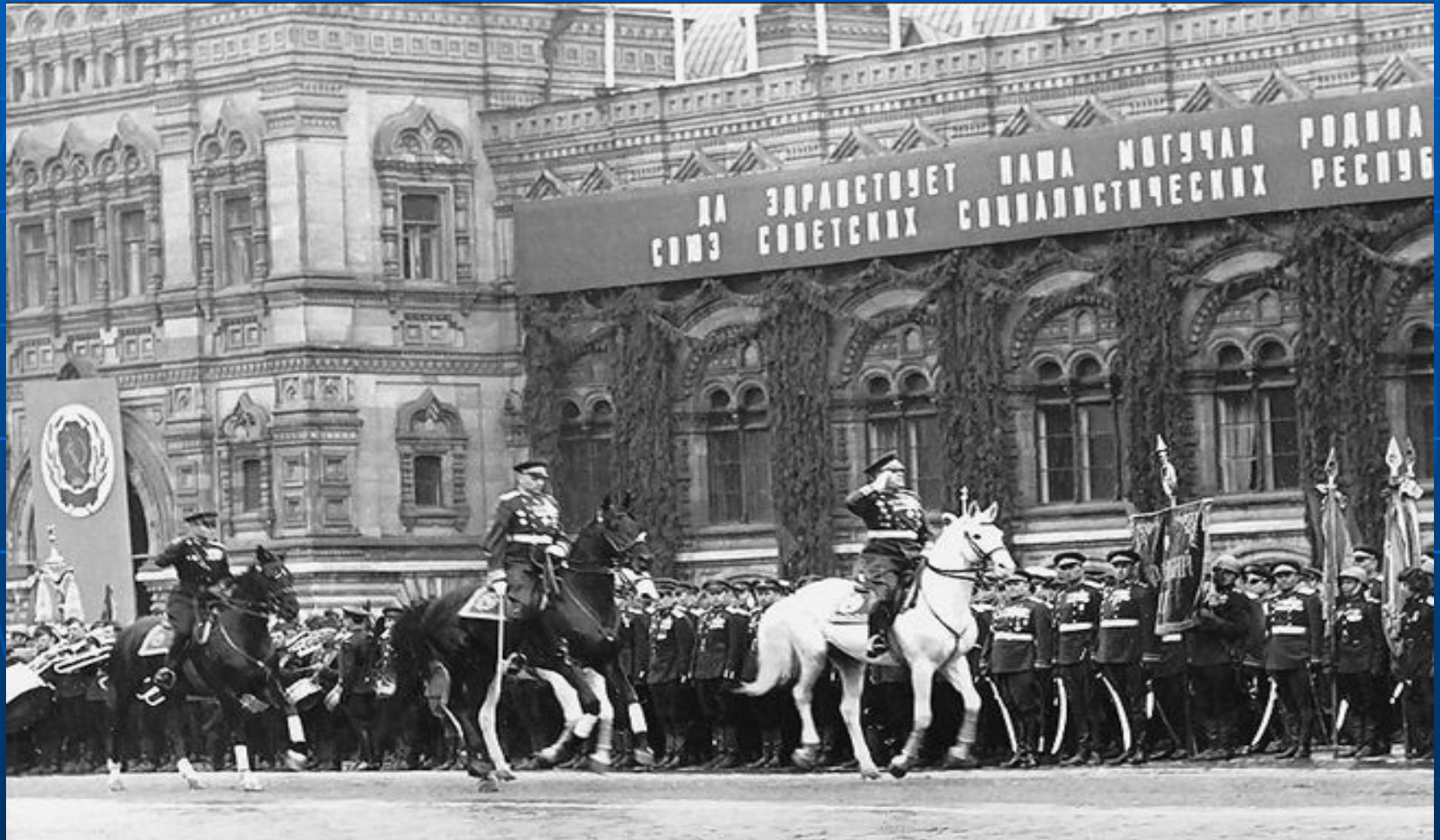
Парад Победы. Маршалы Советского Союза Г.К.Жуков и Г.К. Рокоссовский. 24 июня 1945 года. Красная площадь.