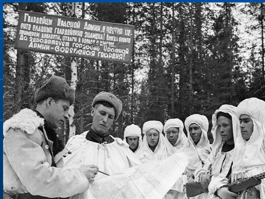
Разведчики получают боевое задание