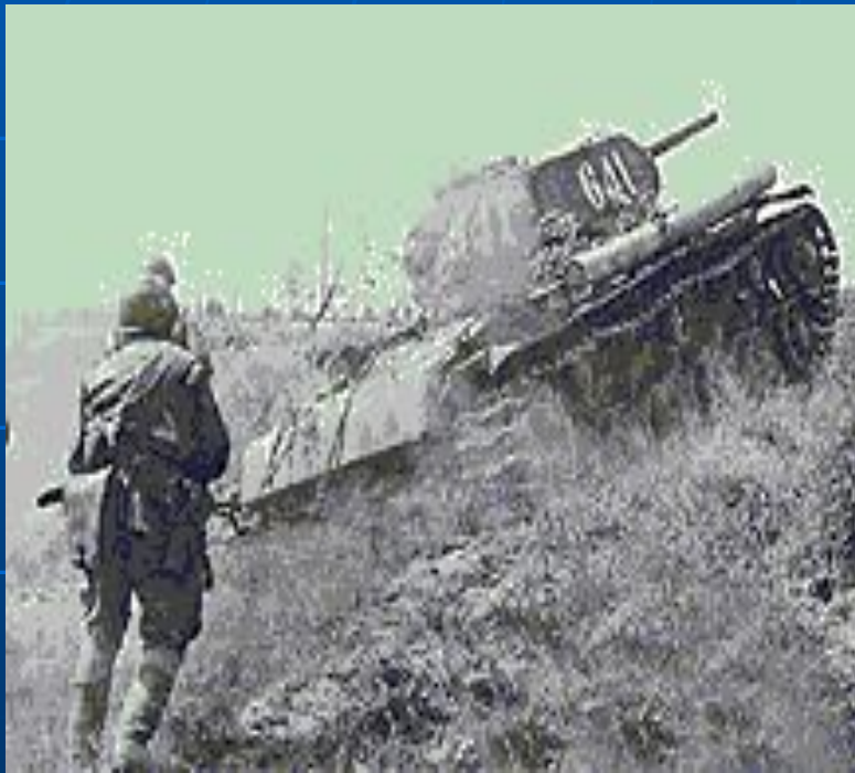
Курская битва. Пехота идёт в атаку под прикрытием танков