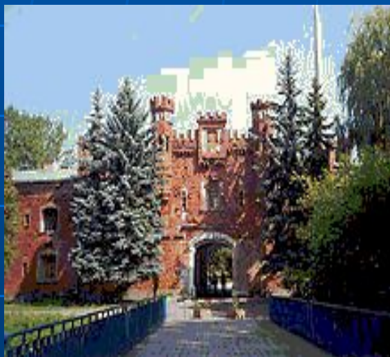
Брестская крепость. Холмский ворота.