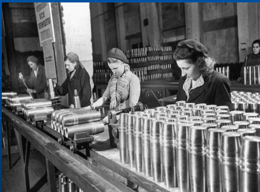
На артиллерийском заводе