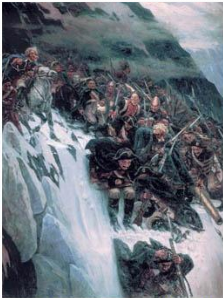
Переход Суворова через Альпы в 1799 году Василий Суриков, 1899г.