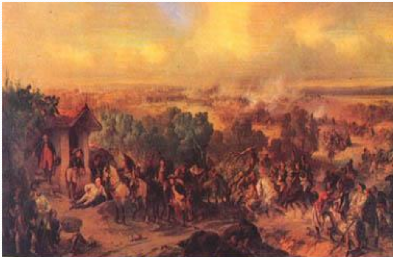
Битва при Треббиа Коцебу Александр Евстафиевич, до 1889 года