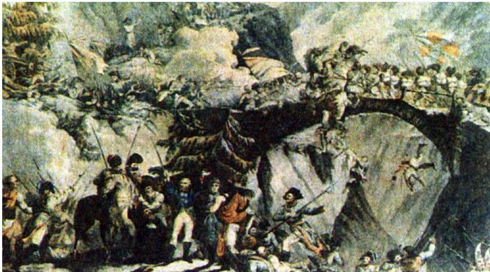
"Переход Суворова через Чертов мост", Роберт Портер (1781—1842)