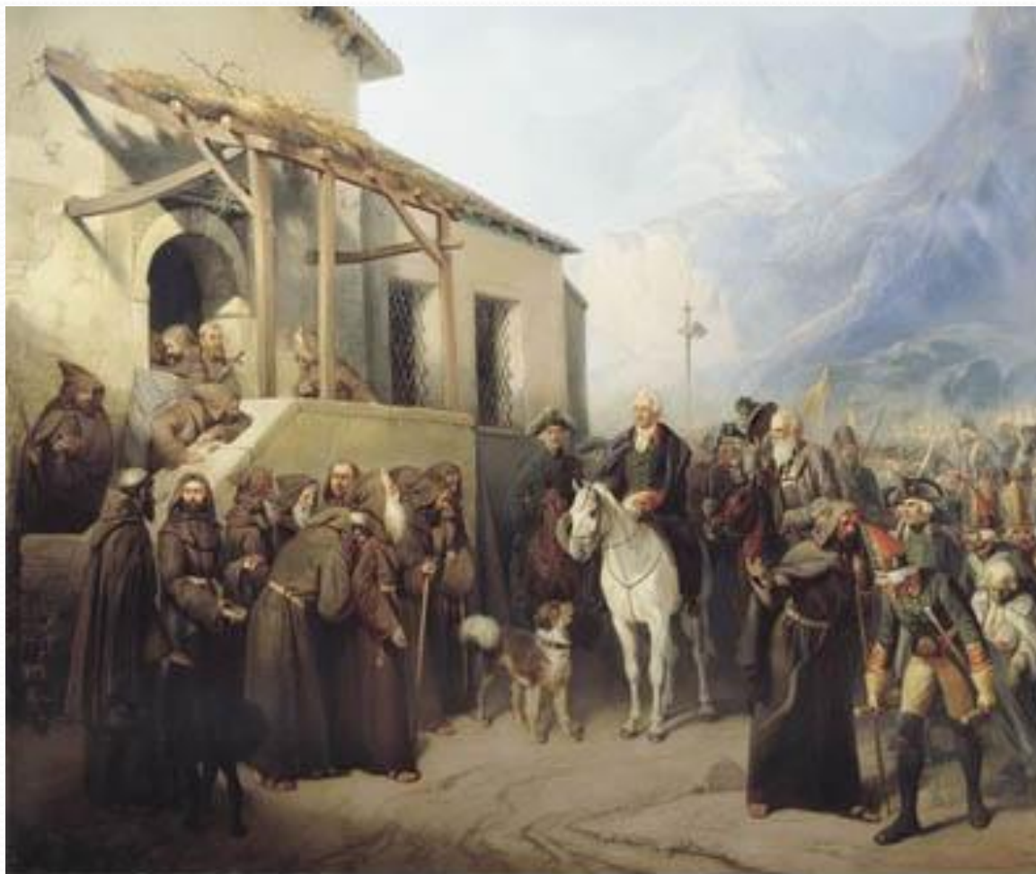
Фельдмаршал Суворов на вершине Сен-Готарда 13 сентября 1799 года Шарлемань Адольф Иосифович, 1855г.