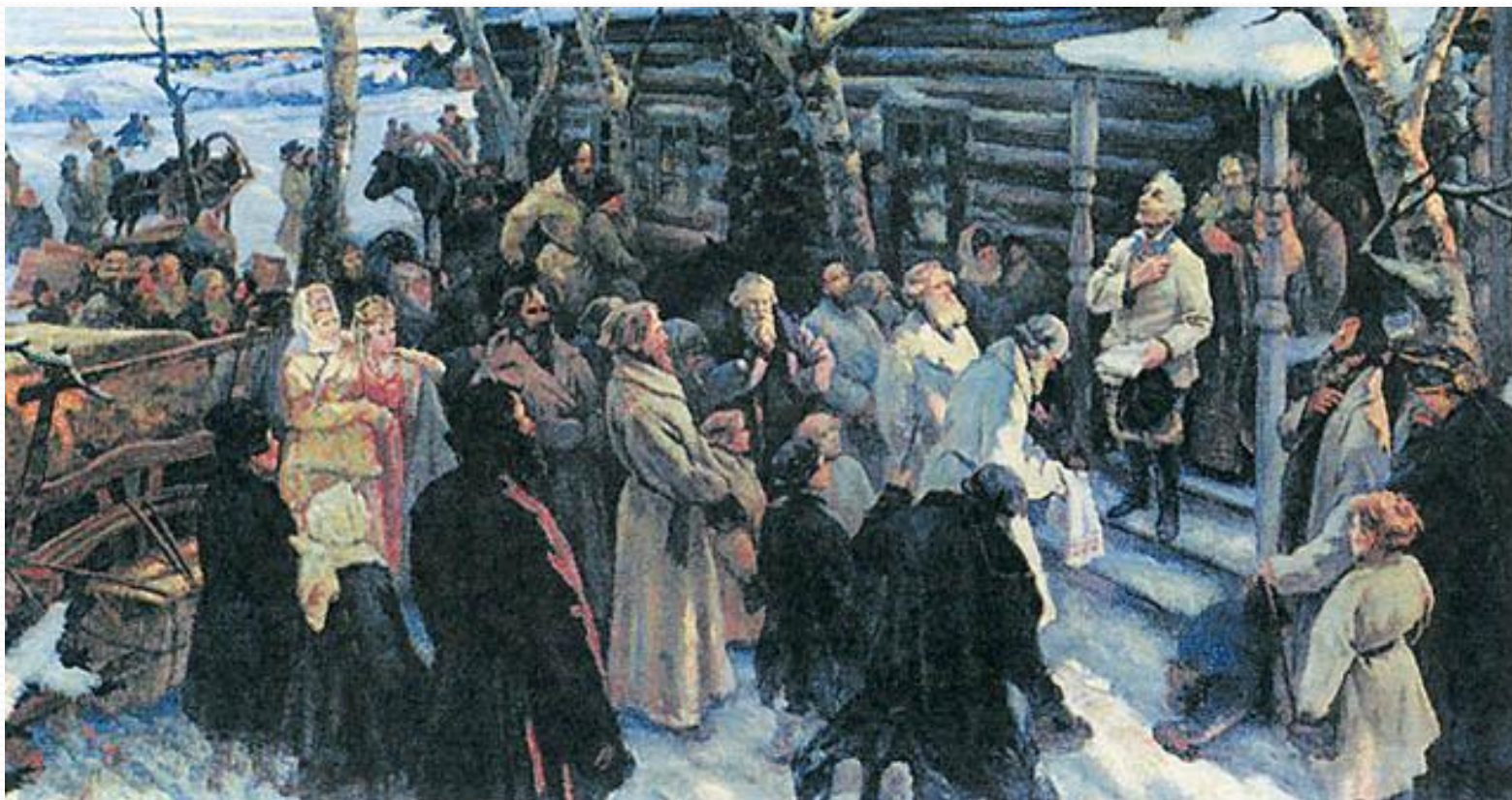
"Отъезд Суворова из села Кончанского в поход 1799 года" Н.А. Шабунин, 1903 г.