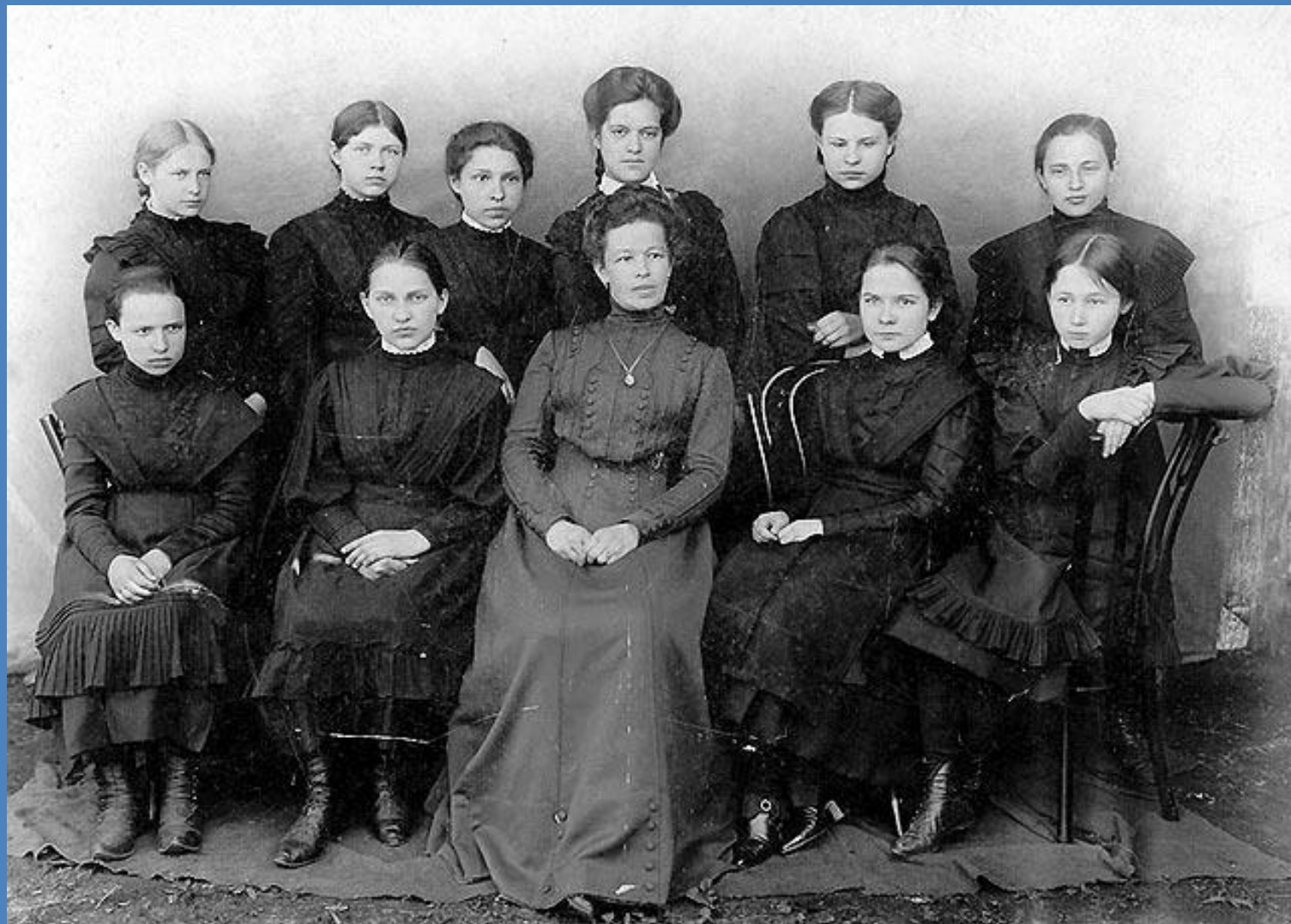
Ученицы Сапожковской женской гимназии Рязанской области, 1913 год