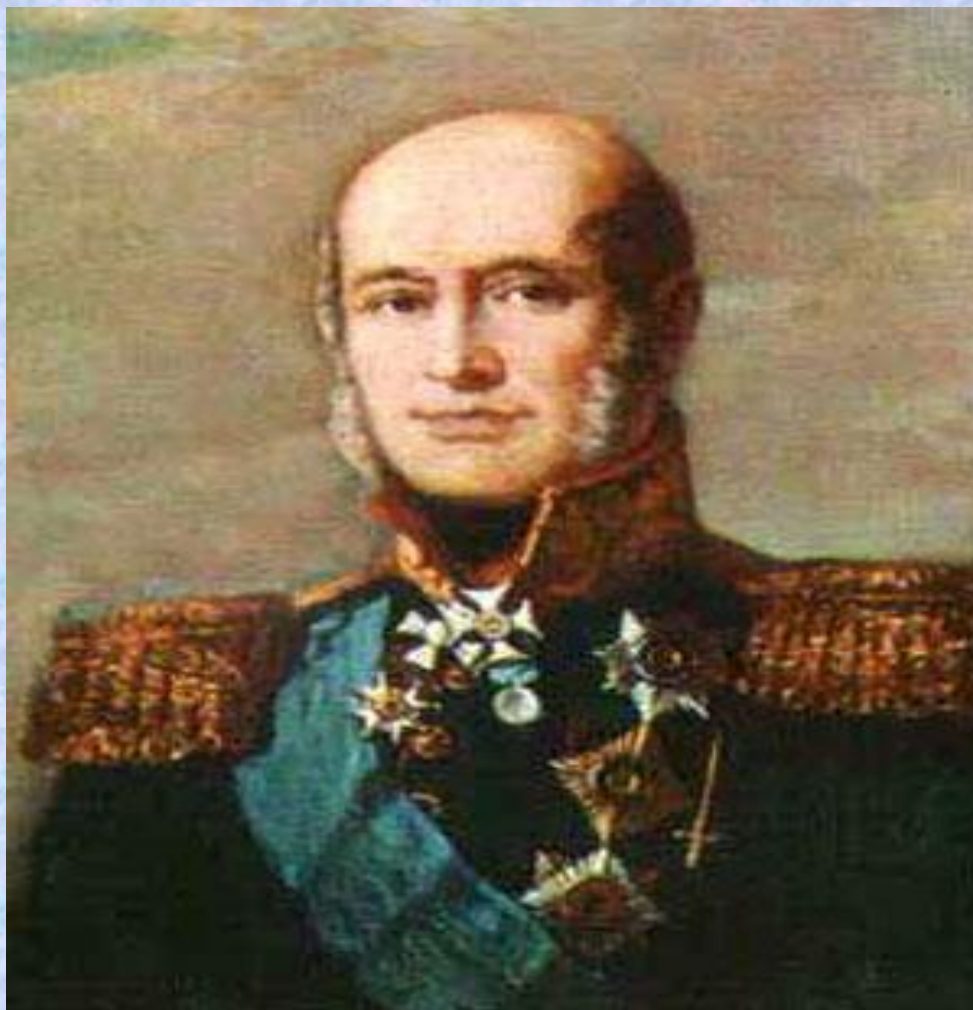
Барклай- де- Толли Михаил Богданович