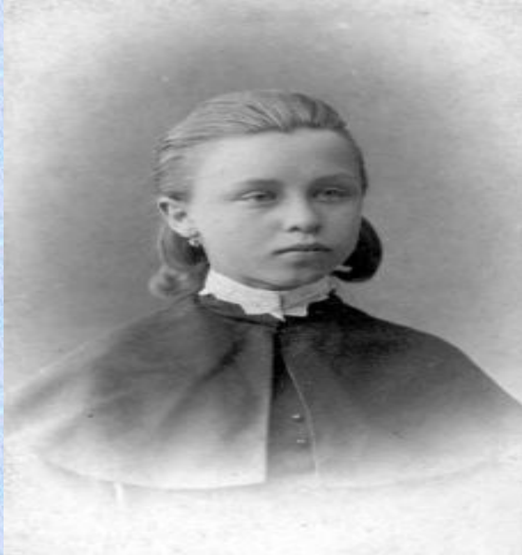
Дурова Надежда Андреевна.