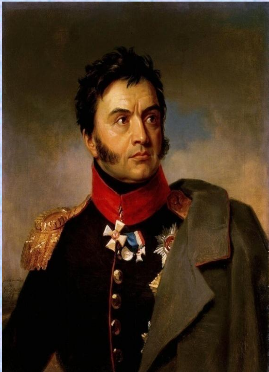
Раевский Николай Николаевич.