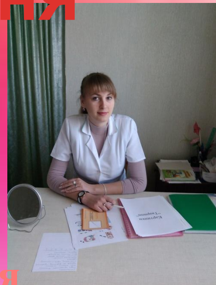
Підготовка до заняття