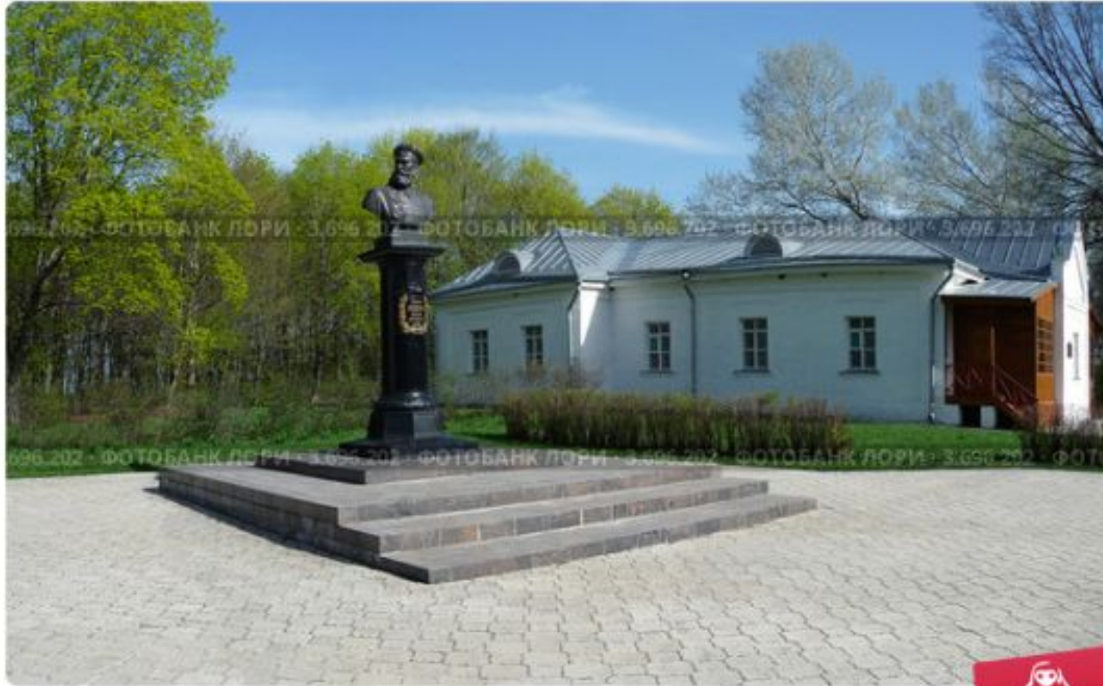
Музей генерала М.Д.Скобелева в усадьбе Заборово Рязанской области