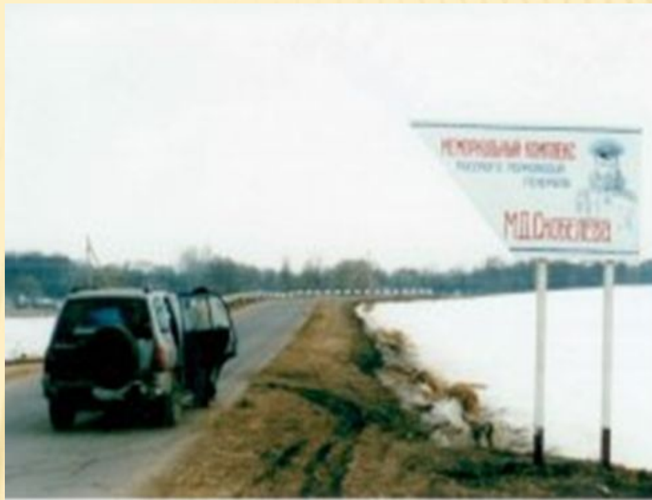
Указатель поворота с трассы в усадьбу