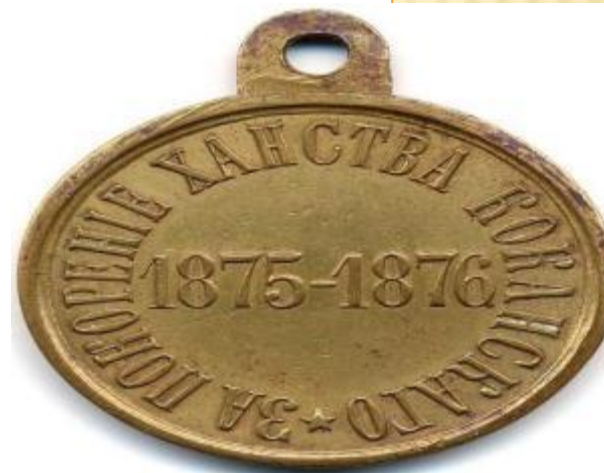
Медаль в честь покорения Кокандского ханства

В ЭКСПОЗИЦИИ МУЗЕЯ ПРЕДСТАВЛЕН ЖИЗНЕННЫЙ И БОЕВОЙ ПУТЬ ГЕНЕРАЛА, ПОРТРЕТЫ И БИОГРАФИИ ЕГО РОДСТВЕННИКОВ, МУЛЯЖИ ЦАРСКИХ НАГРАД, ПАМЯТНЫЕ ЗНАКИ И ПРЕДМЕТЫ. ЧАСТЬ ЭКСПОЗИЦИИ ПОСВЯЩЕНА ШКОЛЕ.