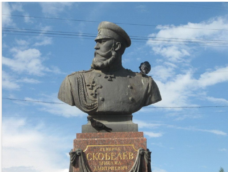
Бюст Скобелева в Рязани