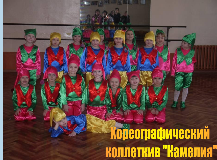
Хореографический коллектив "Камелия"