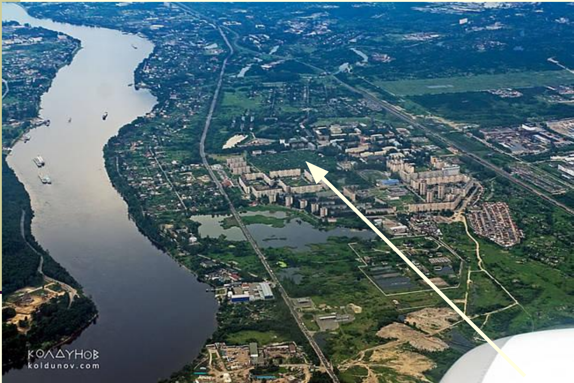
Садоводческое некоммерческое товарищество «Нева»