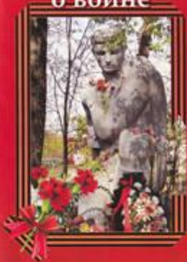
Книга «По крупицам о войне»