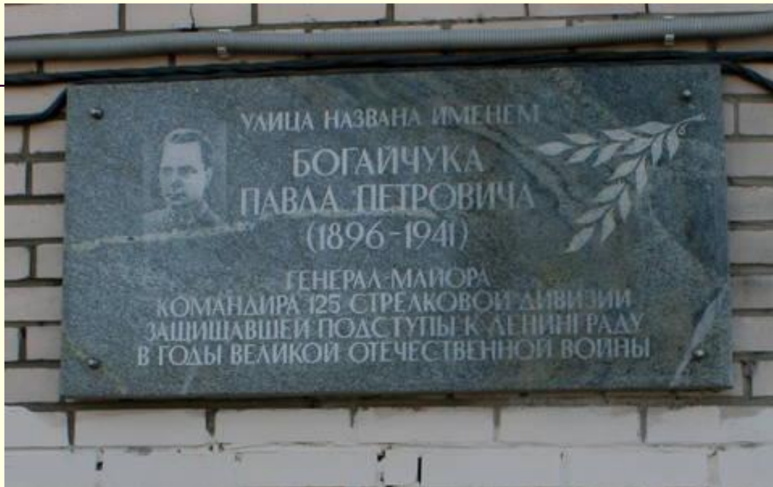
Мемориальная доска на доме №2