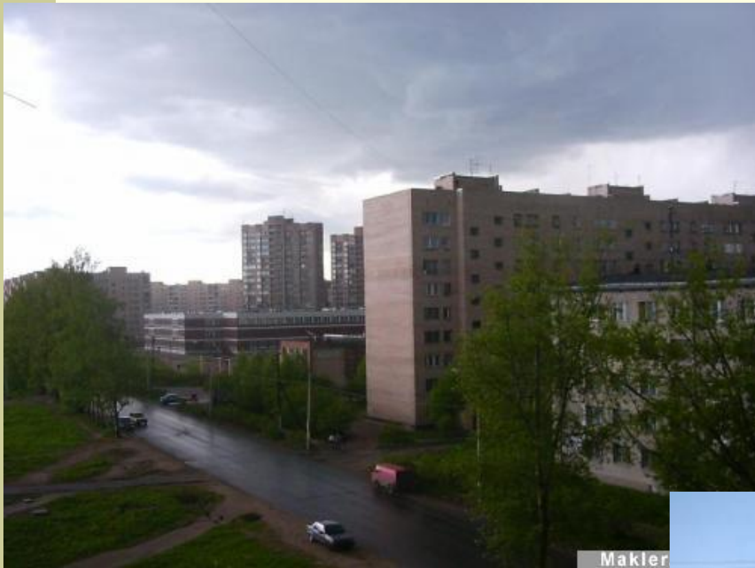
Улицы Садовая и Полевая