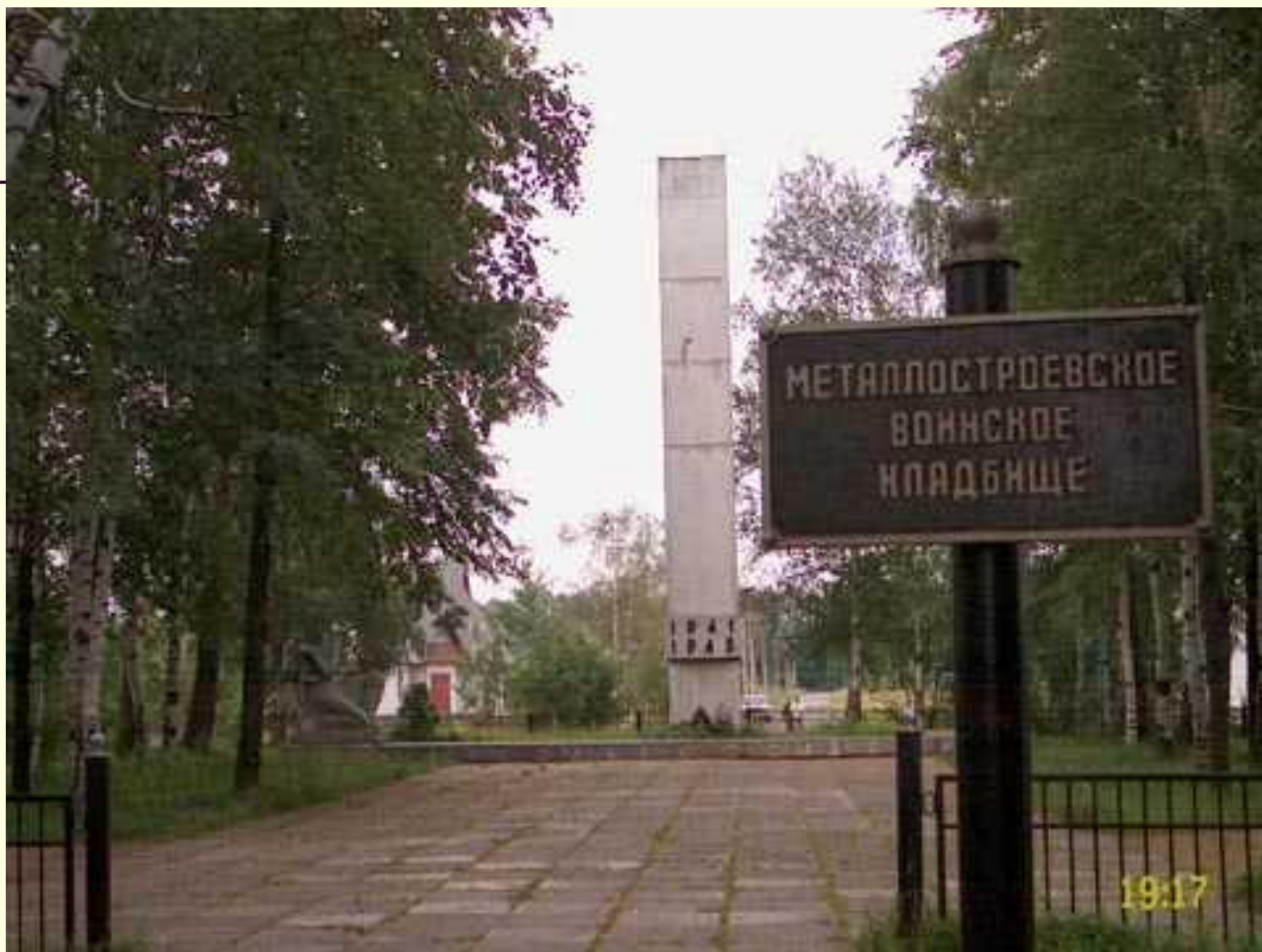
Металлостроевское воинское кладбище