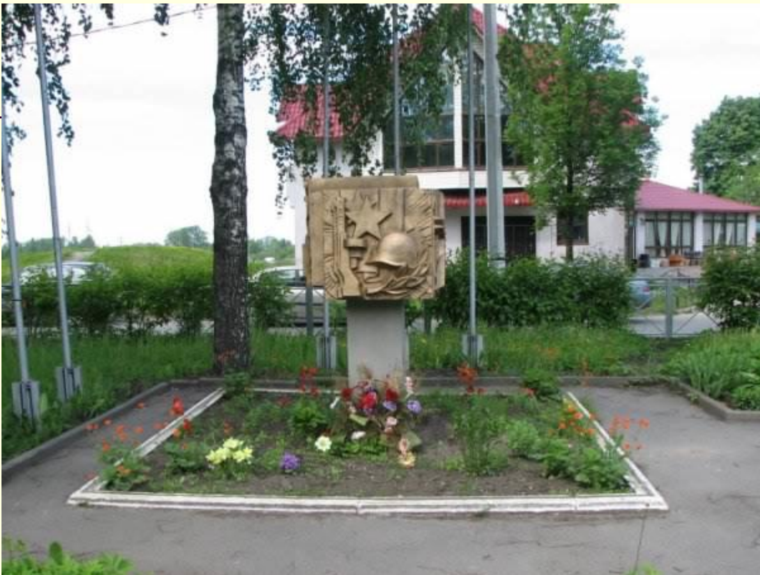
Сквер Памяти поколений