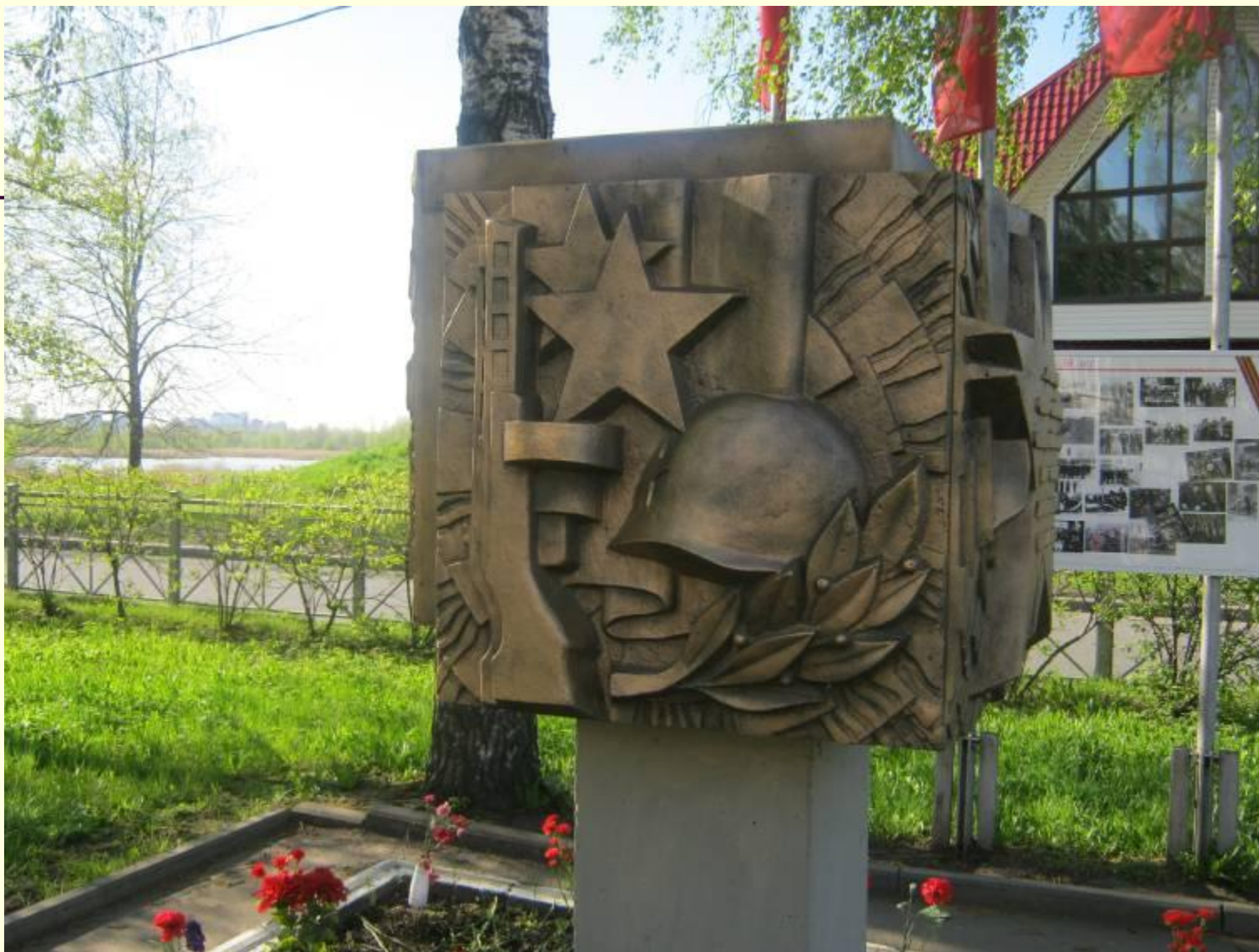
Монумент (памятный знак) в сквере "Памяти поколений" на углу ул. Богайчука и ул. Полевая