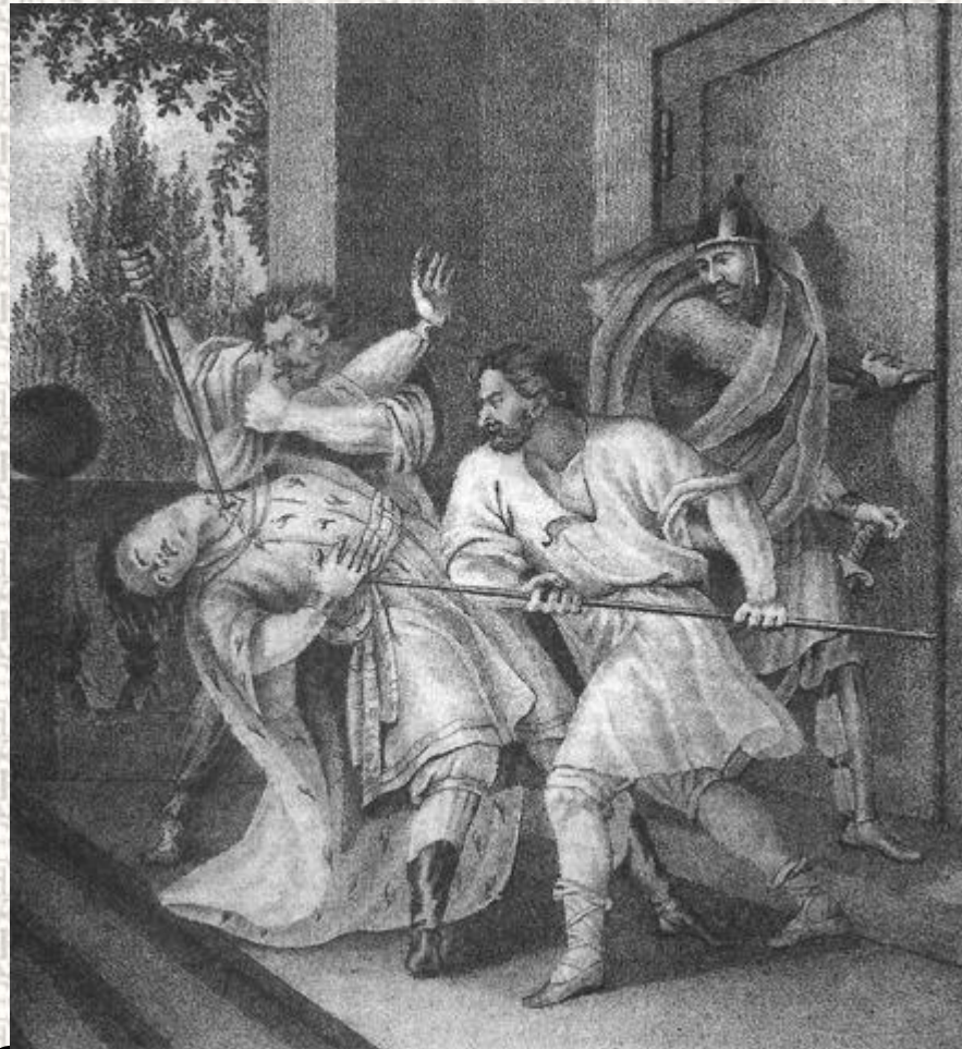
Чориков Б. Смерть Ярополка

Затем, собрав большую воинскую силу, Владимир пошел на Киев. Ярополк не решился вступить в битву. Обманом и коварством с помощью предателей Владимир выманил Ярополка, и варяги мечами поразили его. Покончив с братом, Владимир занял княжеский стол в Киеве.