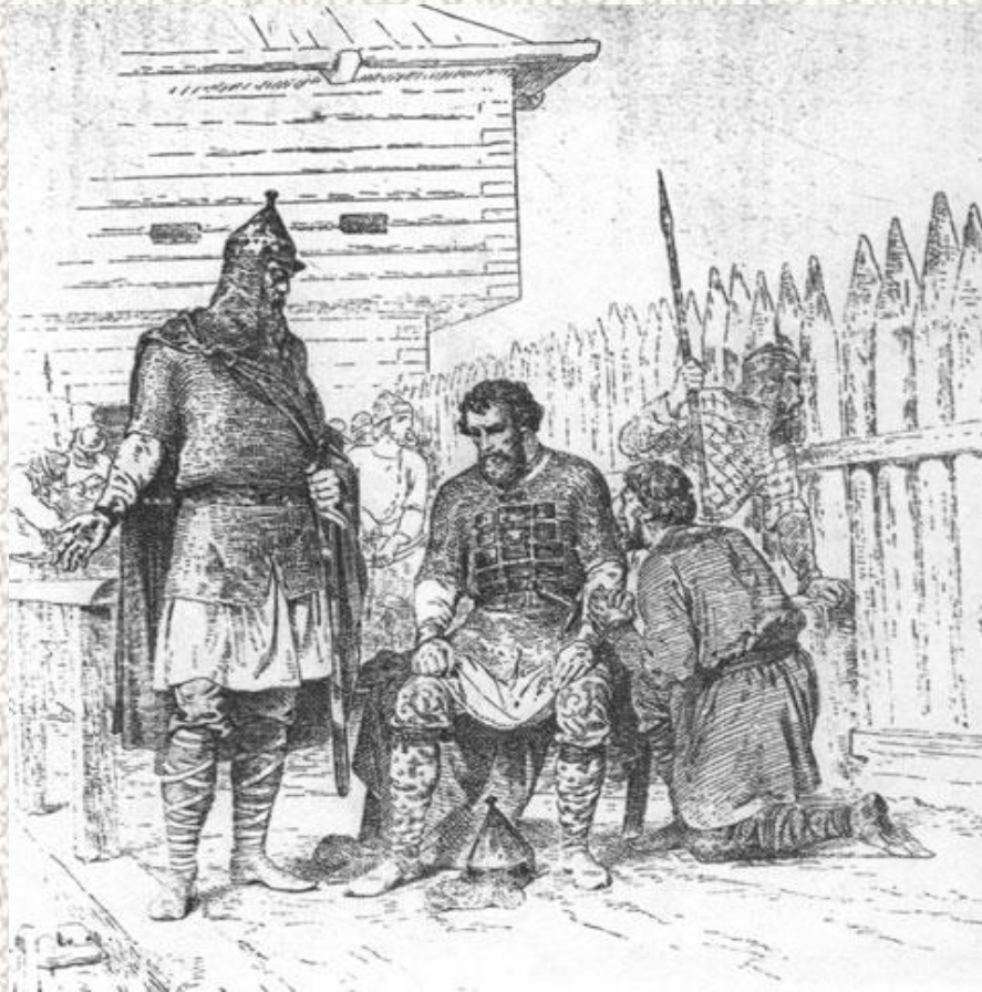
Верещагин В. Великий князь Ярополк Святославович

Узнав о смерти Олега, Владимир решил отомстить Ярополку и отправился за помощью к варягам. «Не я зло начал, мне должно за кровь невинную мстить и себе снискать безопасность», — так оправдывал себя Владимир-язычник, готовясь выступить против Ярополка.