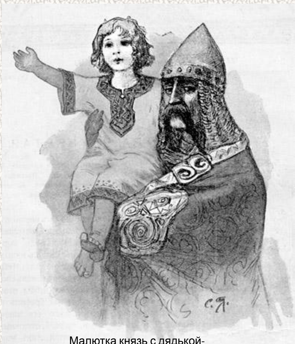
Малютка князь с дядькой- кормильцем

В Древней Руси княжеские заботы на наследников великих князей ложились из-за безвременной кончины отцов очень и очень рано.