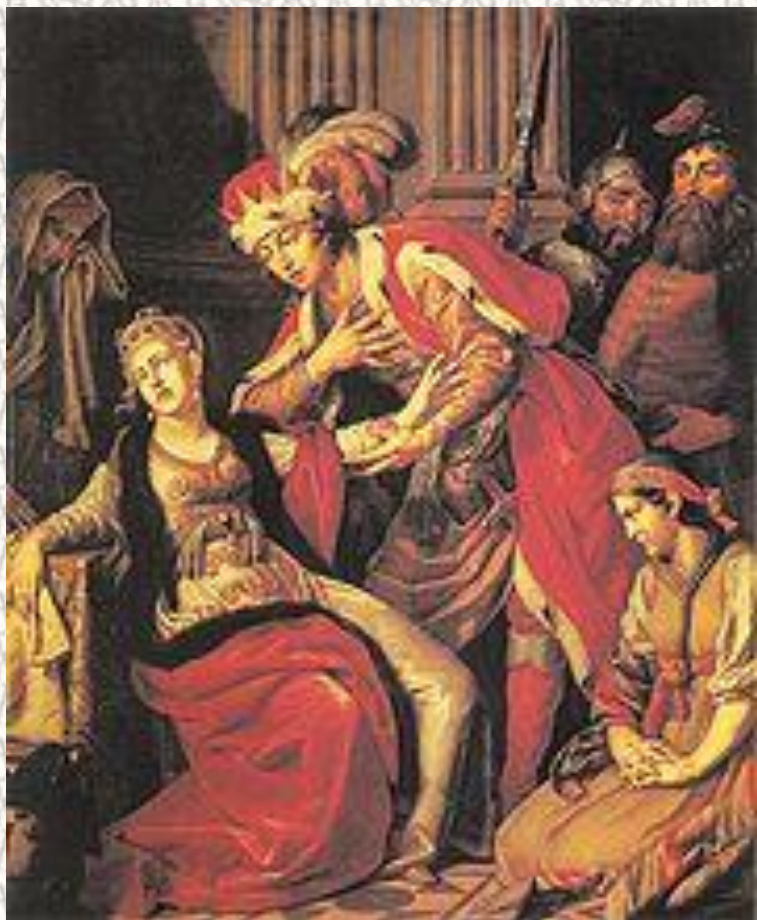
А. П. Лосенко. Владимир и Рогнеда, 1770

Рогнеда же объявила, что хочет быть женою князя Ярополка, а не Владимира, рожденного от Святослава Малушей — служанкой Ольги.