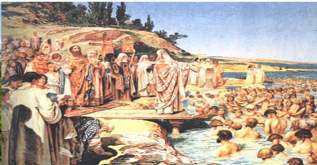
Лебедев К.В. Крещение