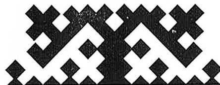
рога оленя самца