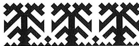
рога дикого оленя