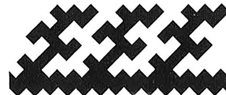
ушки молодого соболя