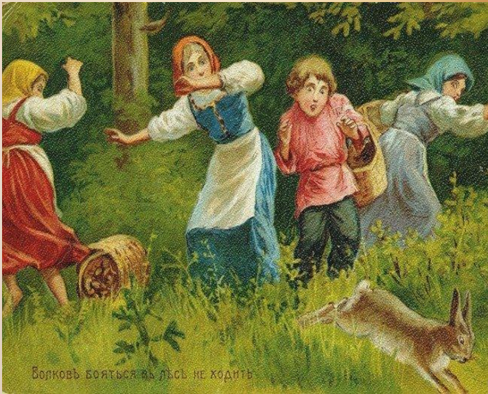
Волков бояться в лес не ходить