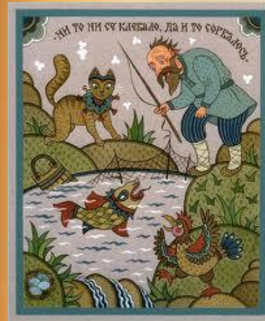
Ми то ни се кѣсало, да и то согладоу.