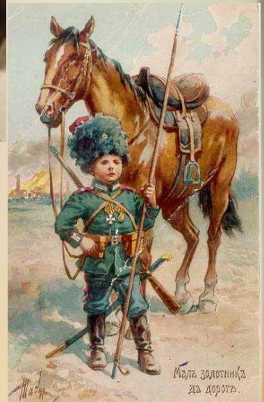
Малъ золотникъ да дорогъ.