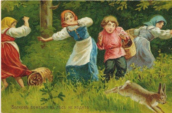
Волковъ бояться въ дѣсь не ходитъ.