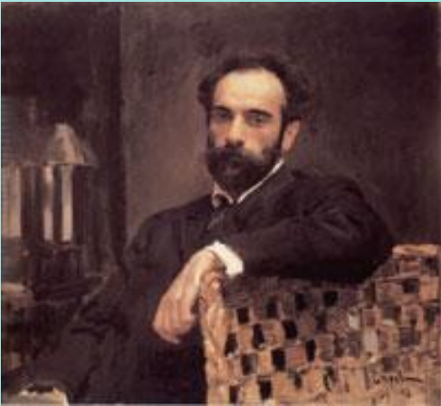
В.Серов «Портрет И.Левитана»