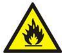
Пожароопасно. Легковоспламеняющиеся вещества