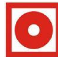
Кнопка включения установок (систем) пожарной автоматики