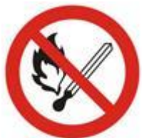
запрещается пользоваться открытым огнем и курить