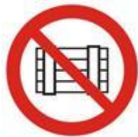
Запрещается загромождать проходы (или) складировать