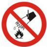
Запрещается тушить водой