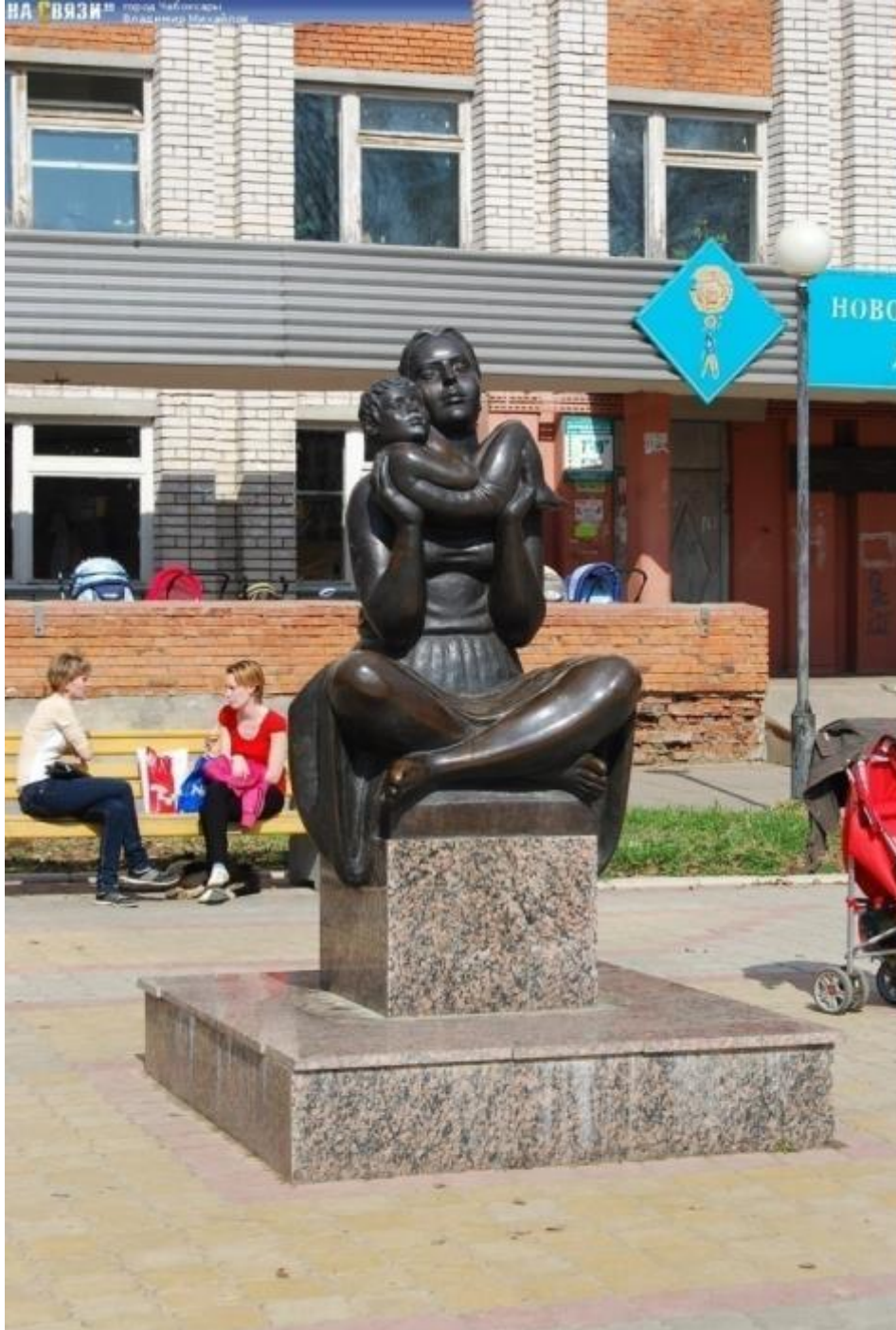
г. Новочебоксарск Памятник матери и ребёнку у входа в детскую больницу