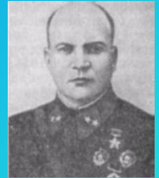
Лизюков Александр Ильич (1900-1942 г.)