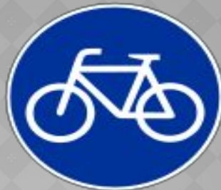
Разрешается ездить велосипедистам