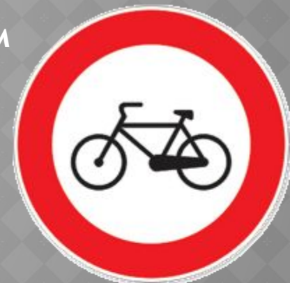
Ездить на велосипеде запрещено