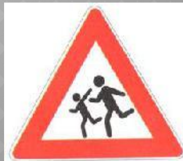
Водитель, внимание! Дети!