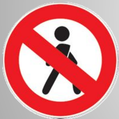
Движение пешеходов запрещено