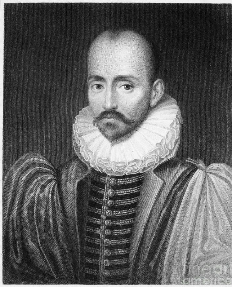
Engraved by C. B. Wagstaff