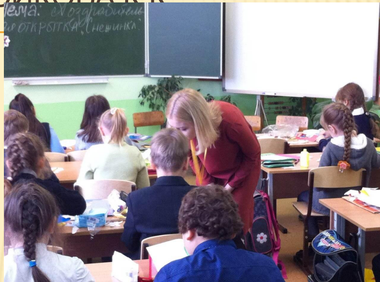
Начало выполнения работы