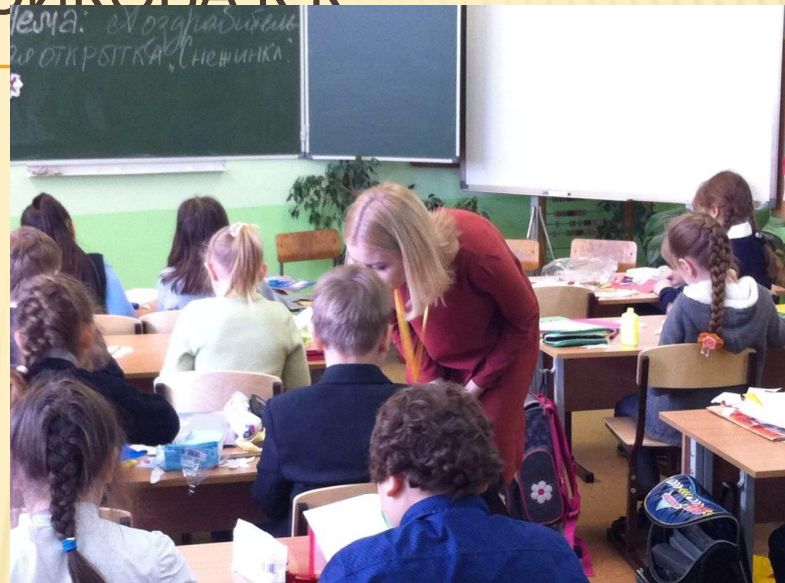
Начало выполнения работы