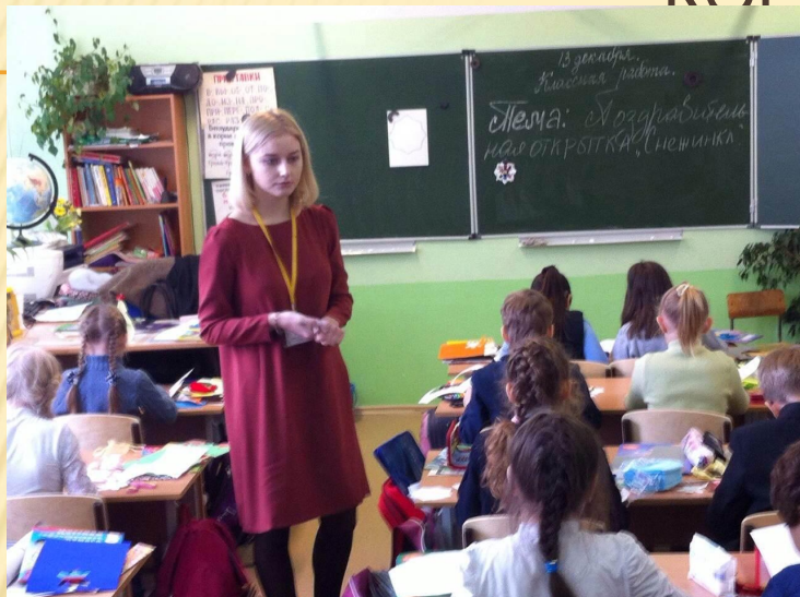
Объяснение темы занятия