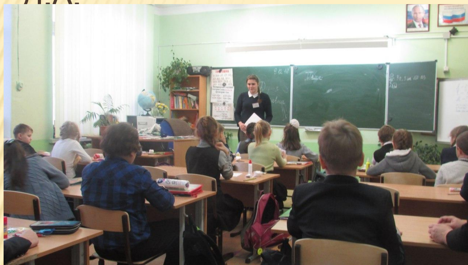
Объяснение темы занятия