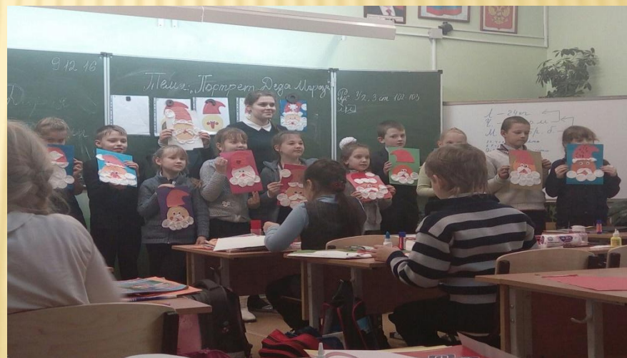
Подведение итогов занятия