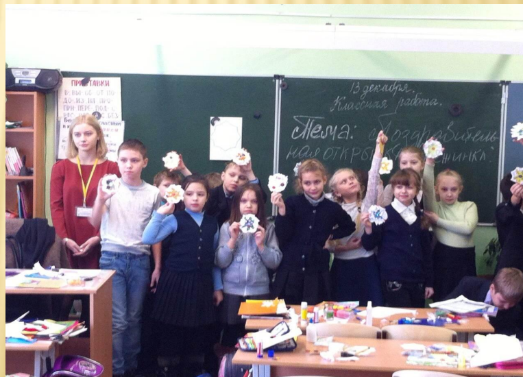
Подведение итогов занятия