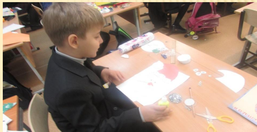
Начало выполнения работы