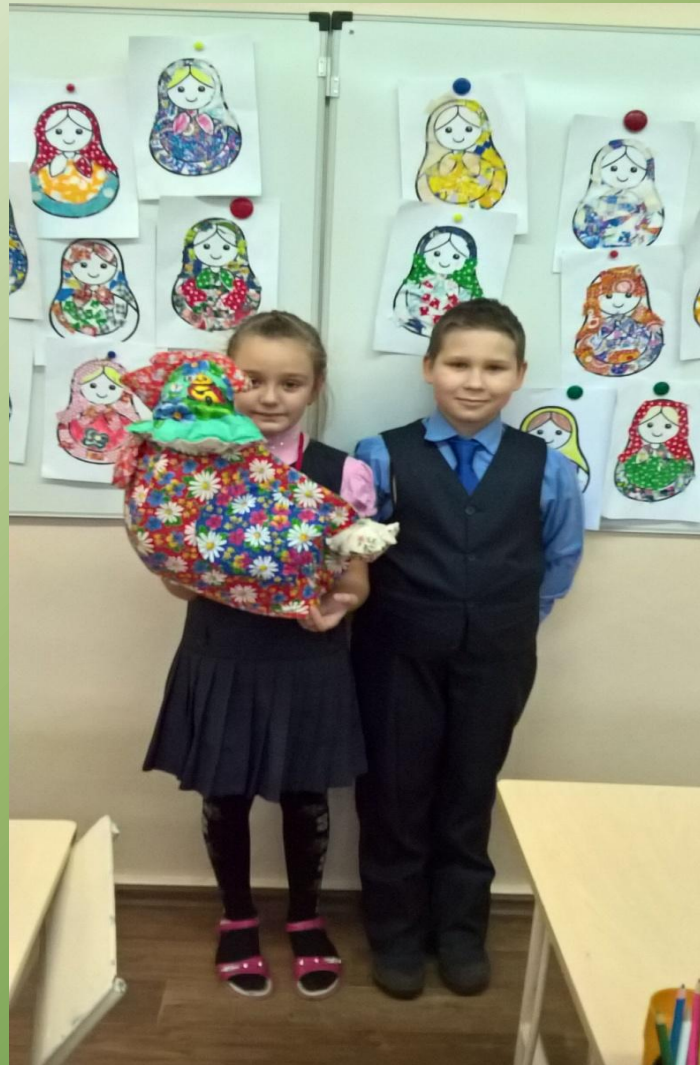
Иллюстрация к сказке.