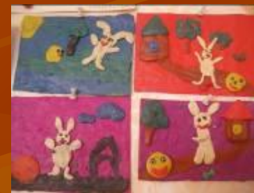
Картинка из пластилина