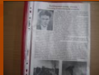
Мой родственник в годы Великой Отечественной войны