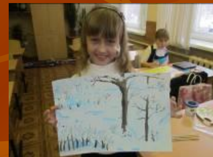
Районный конкурс юных художников