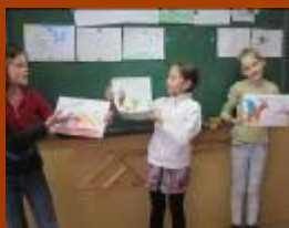
Конкурс «Необычное животное»