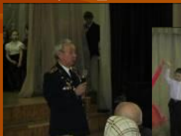
Встреча с ветеранами