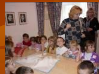
Музей М. Джалиля