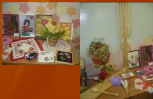
Мастера и мастерицы