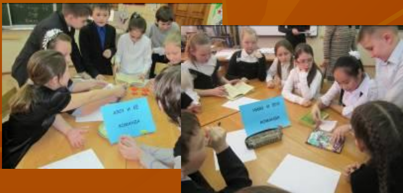
КВН «Тимур и его команда»