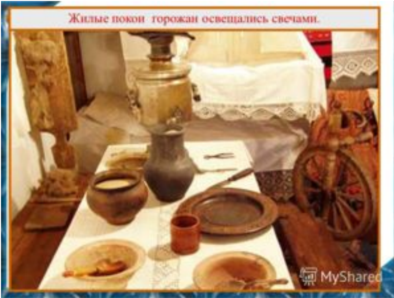
Жилые покои торожан освещались свечами.