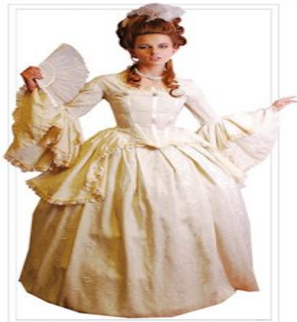
“ЕКАТЕРИНА” Агр И180101