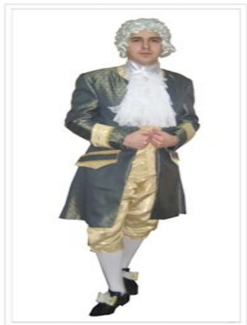
“БЕТХОВЕН” Агр И180214