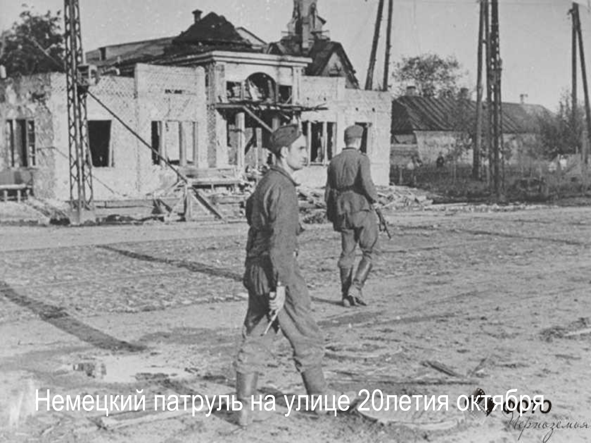
Немецкий патруль на улице 20летия октября