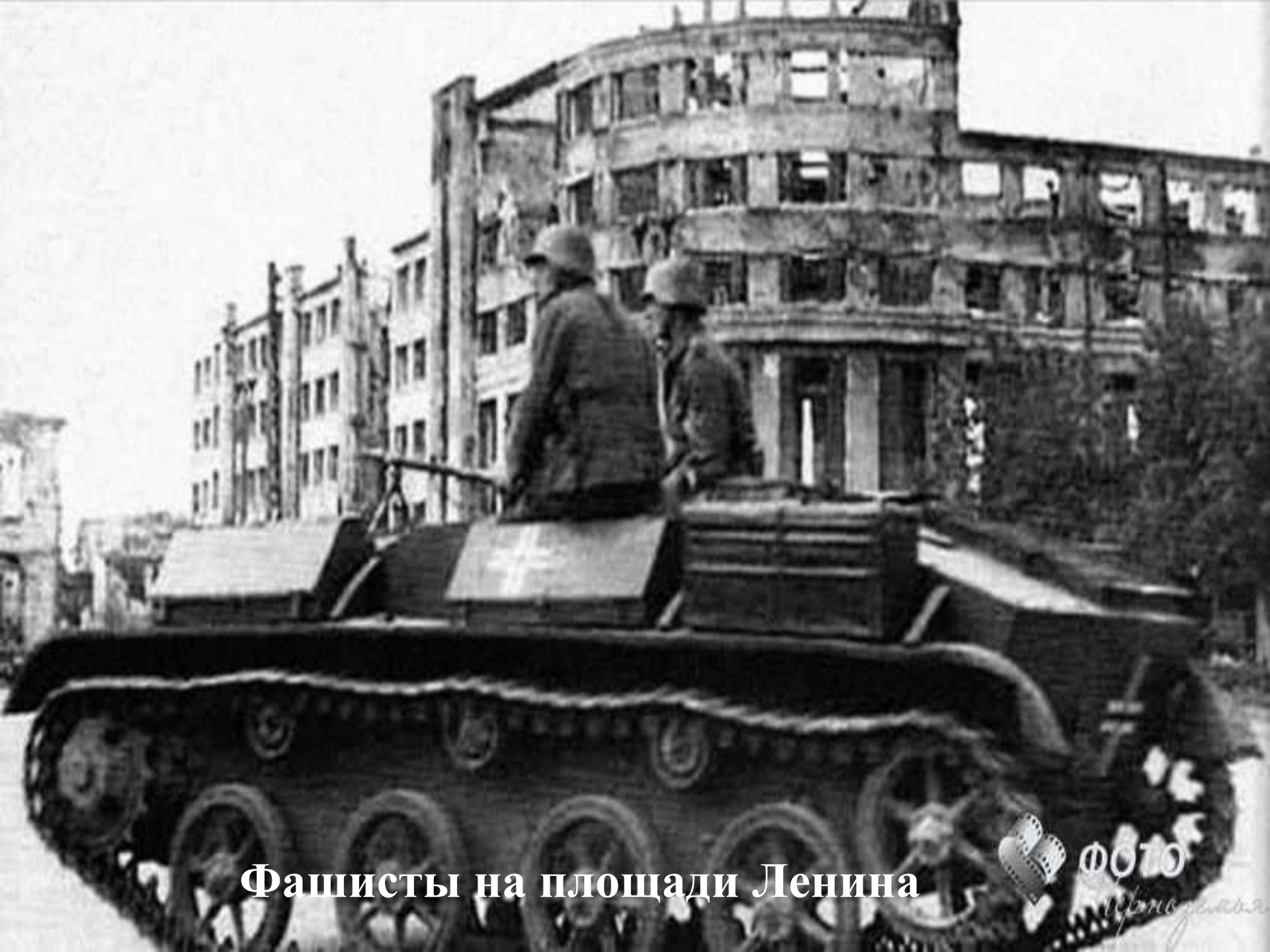
Фашисты на площади Ленина