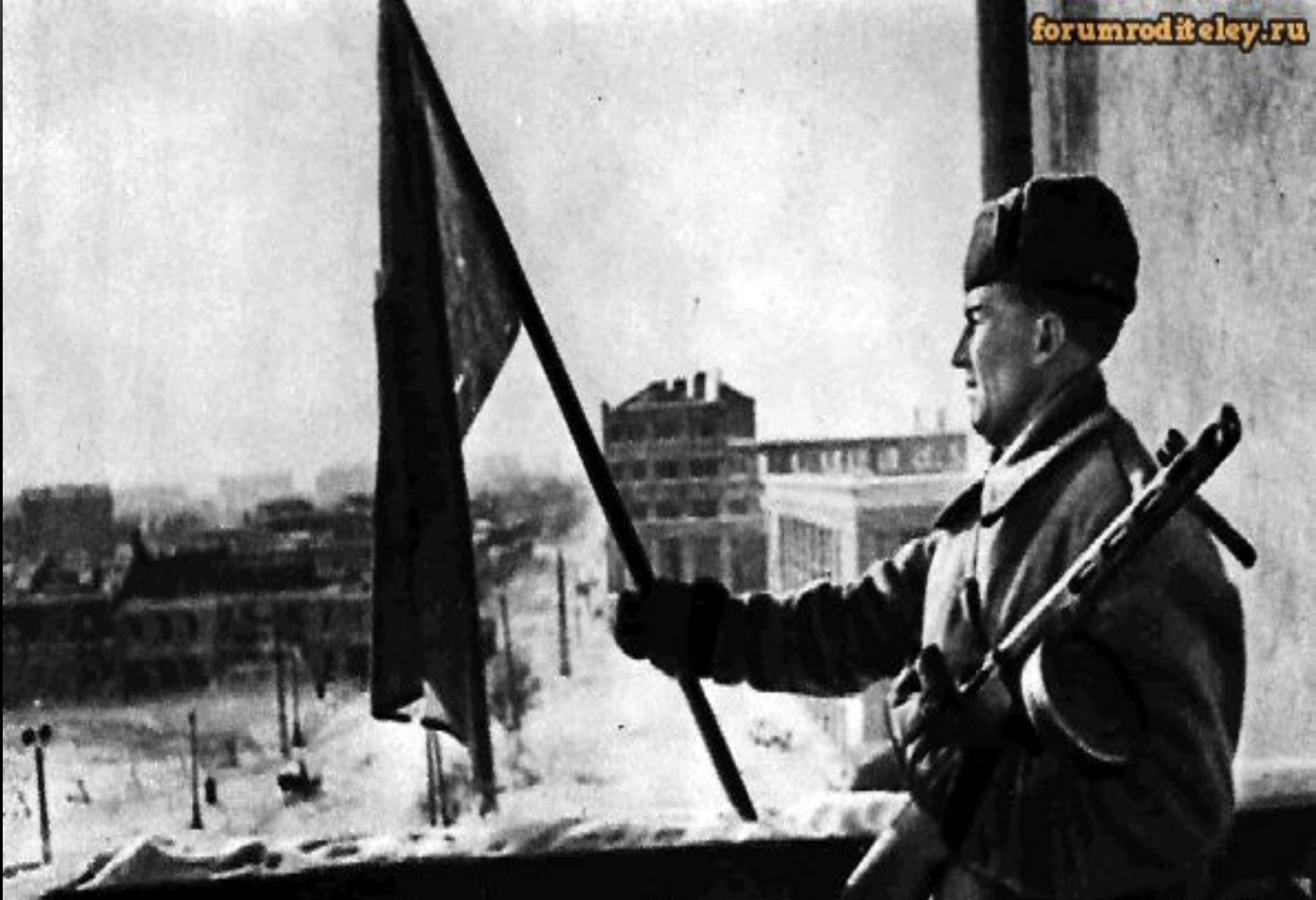
Знамя над освобожденным Воронежем. 25 января 1943 г.