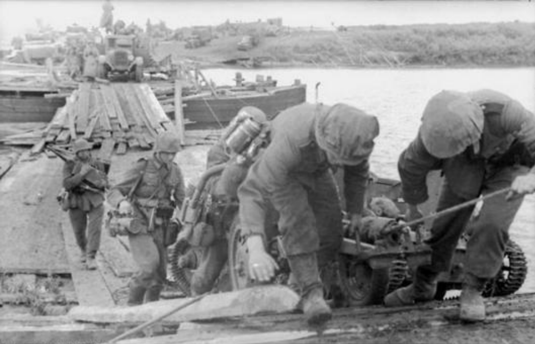
1942 Juni - Juli