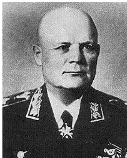
Ф.И.Голиков командующий Воронежским фронтом