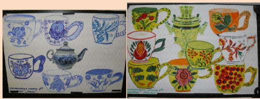
коллективные работы "У самовара"