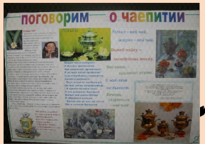
коллективные и индивидуальные проекты