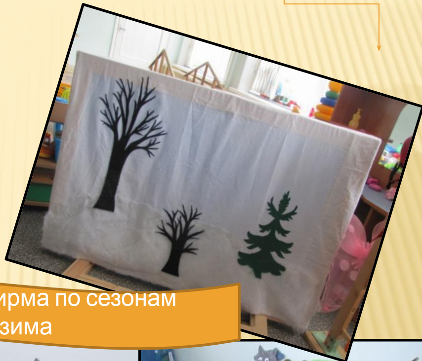
Двусторонняя ширма по сезонам лето-зима