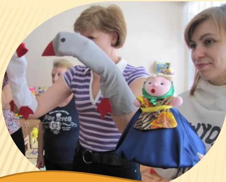
«Два веселых гуся». Персонажи выполнены из носков