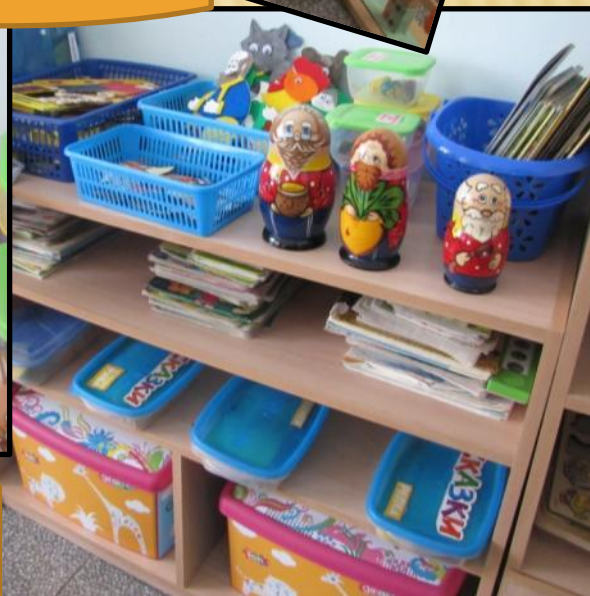
Виды театров в группе