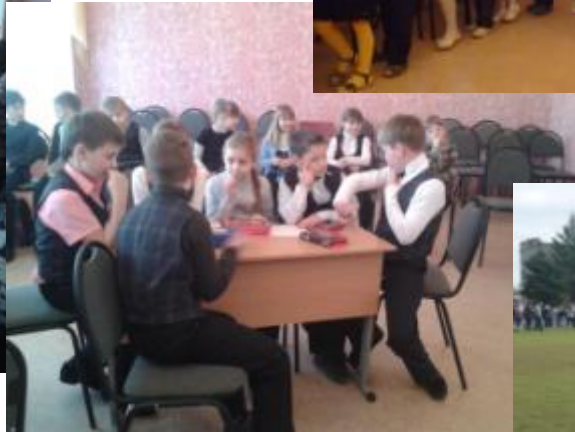
Викторины по русскому языку , математике 4а,б,в,г.