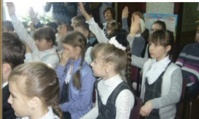
Книжный фристайл в библиотеке № 1