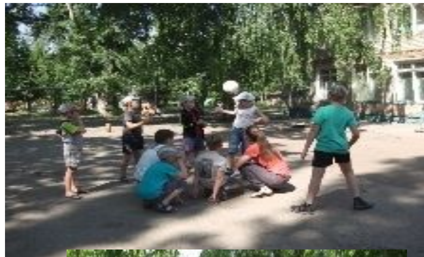
Организация игр на летней площадке