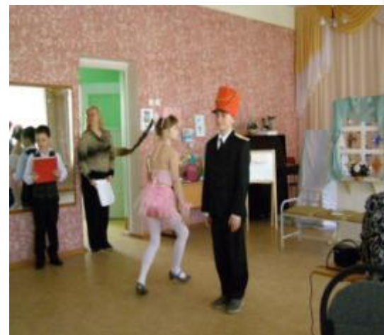
«По сказкам Андерсена»