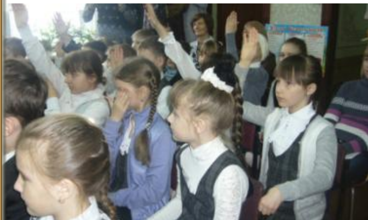
Книжный фристайл в библиотеке № 1