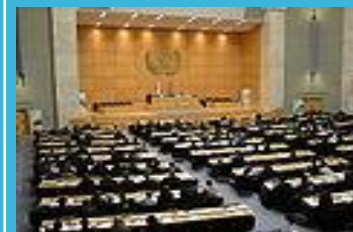
Главный зал ООН в Женеве