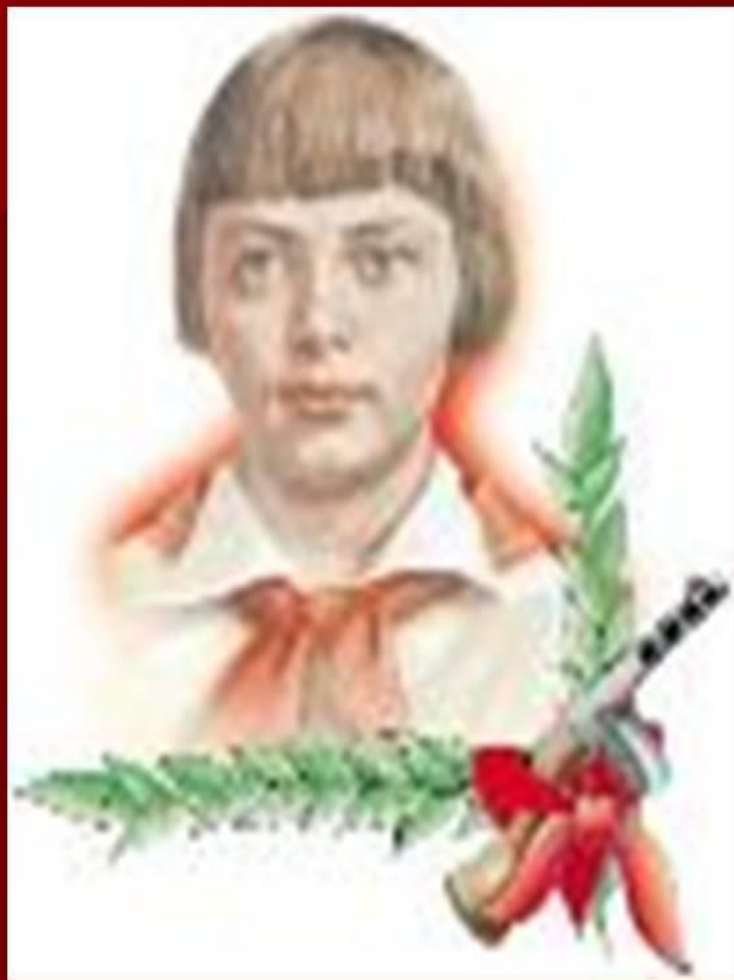
Юная пионерка Зина Портнова

война застала в деревне Зуя, в Витебской области. Ребята создали организацию «Юные мстители». Они помогали партизанам, вели разведку вражеских