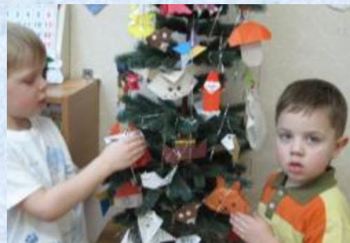
Елка наряжается только фигурками оригами, сделанными нами в совместной деятельности