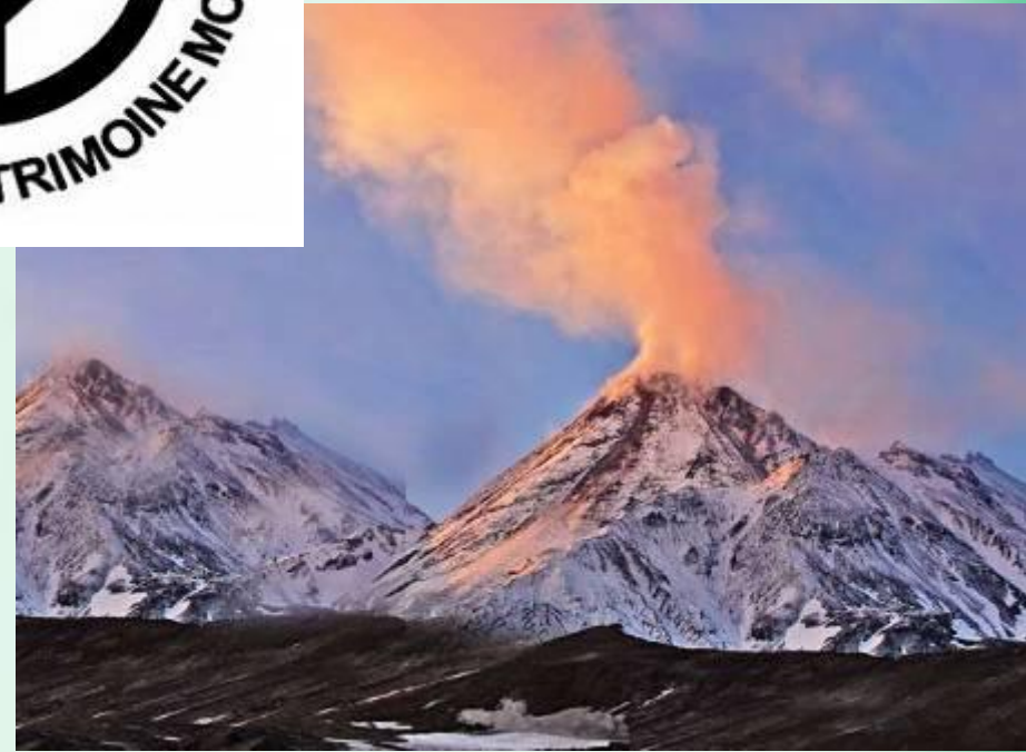
Вулканы Камчатки – объект природного наследия.