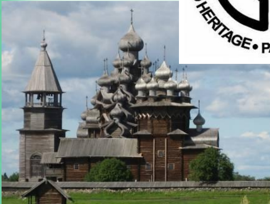
Деревянные церкви Кижи – объект культурного наследия.