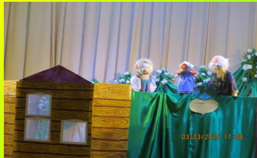
«Сказочное ассорти», 2015 г.