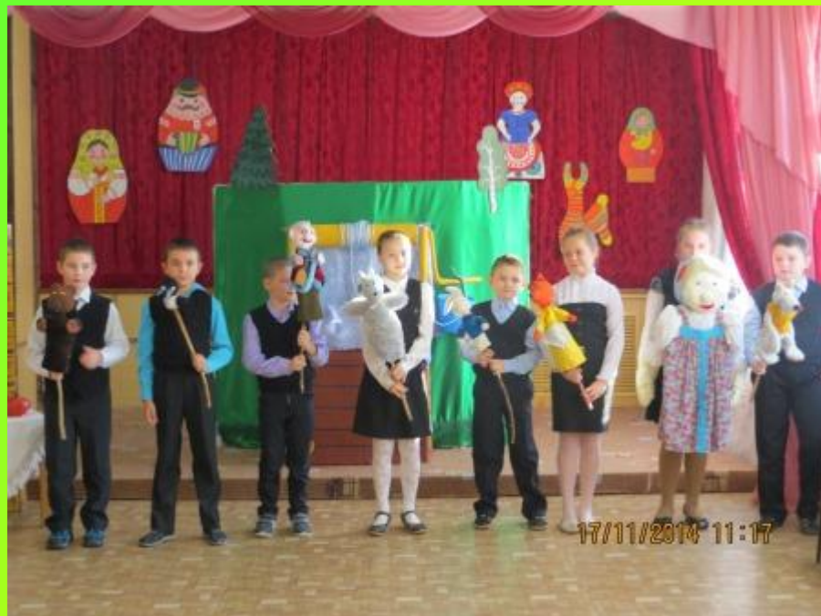
«Колодец», 2014 г.