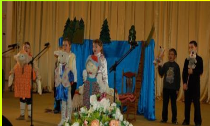
«Сказка про козла», 2013 г.