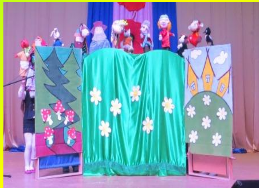
«Бурёнкины истории», 2016 г.